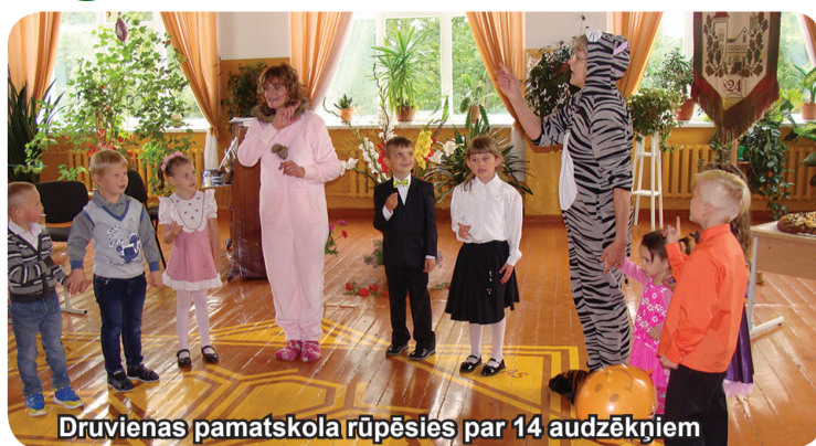
Druvienas pamatskola rūpēsies par 14 audzēkņiem