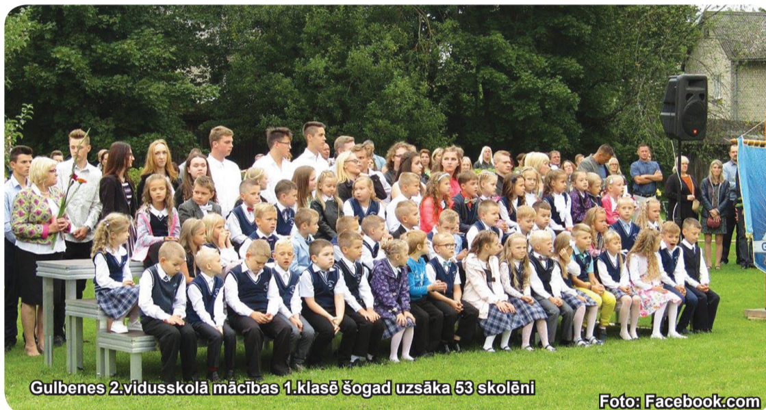
Gulbenes 2.vidusskolā mācības 1.klasē šogad uzsāka 53 skolēni