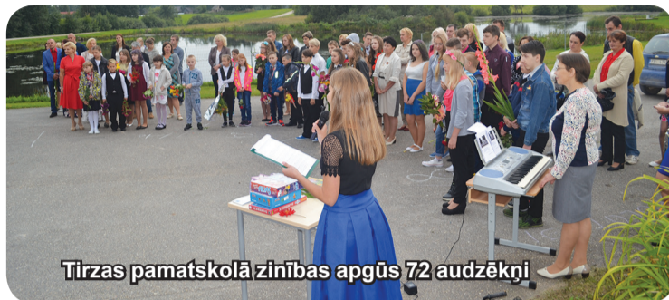
Tirzas pamatskolā zinības apgūs 72 audzēkņi