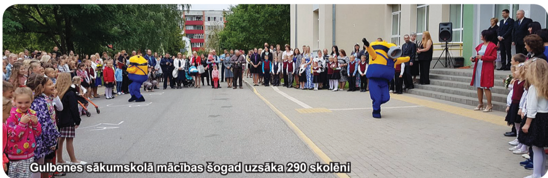
Gulbenes sākumskolā mācības šogad uzsāka 290 skolēni