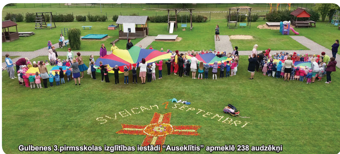
Gulbenes 3.pirmskolas izglītības iestādi "Auseklītis" apmeklēja 238 audzēkņi