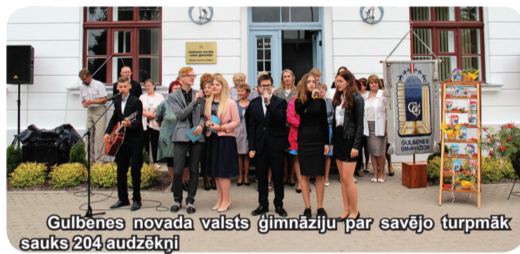
Gulbenes novada valsts ģimnāziju par savējo turpmāk sauks 204 audzēkņi