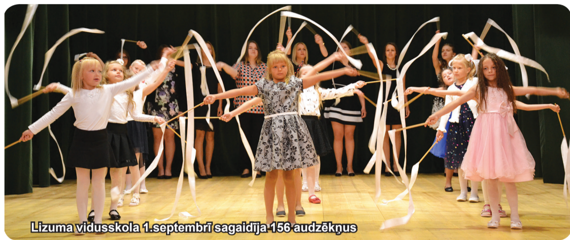
Lizuma vidusskola 1.septembrī sagaidīja 156 audzēkņus