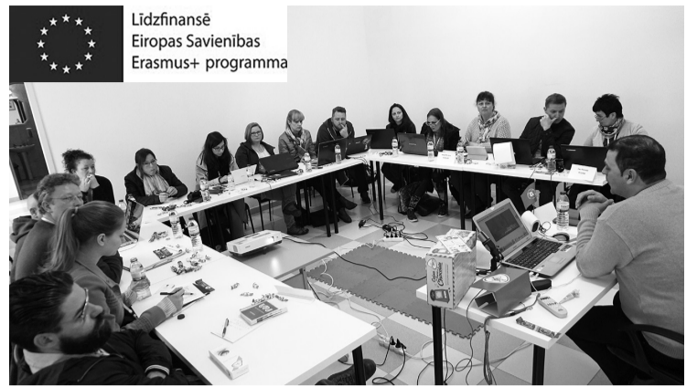
Līdzfinansē Eiropas Savienības Erasmus+ programma

“Kursos piedalījās dalībnieki no Latvijas, Ungārijas, Polijas, Dānijas, Francijas un Spānijas. Mācību mērķis bija radīt 3 filmas (viena filma katrai grupai) par