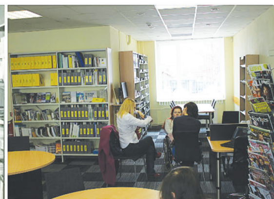
Lasītava 1.stāvā 80-tajos gados un Informācijas centrs 2016.gadā.