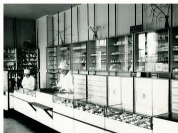
Aptieka Rīgas ielā 55a, 60-tie gadi.

•Arī aptiekas Rīgas ielā 55a fotogrāfiju un stāstu albums par aptieku vēsturi Gulbenē raksturo aptieku pirmsākumus. Ir interesanti uzzināt, ka pēc 2.pasaules kara medikamenti tika piegādāti pa dzelzceļu un mēnesim iedalītos medikamentus varēja atvest 1-2 zirga vezumos, tikai 50-to gadu beigās parādījās pirmās medikamentu piegādes automašīnas.