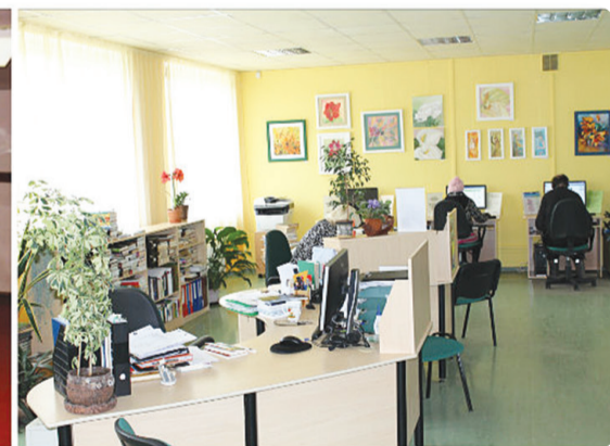
Abonements 1996.gadā un 2016.gadā.