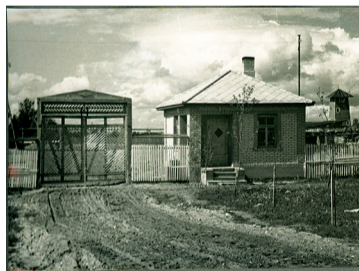
leejas vārti Gulbenes zvērsaimniecības (Beļavas pagasta Letēs) lapsu fermā 50-tie gadi.