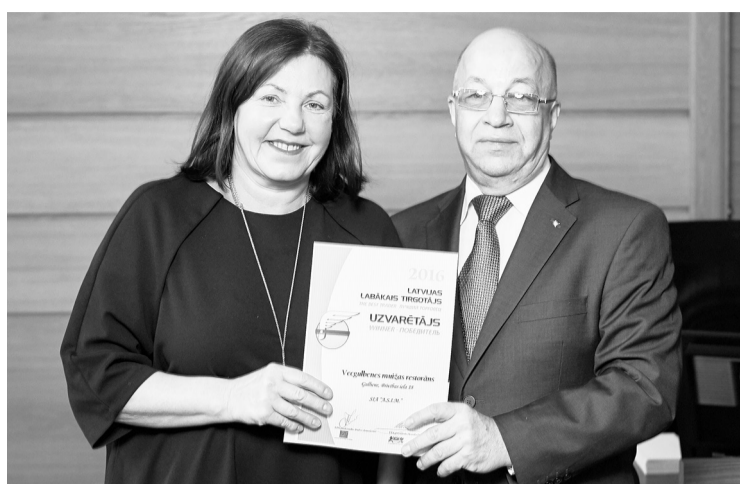
Konkursa dalībnieku vērtēšanas galvenie kritēriji ir apkalpošanas kultūra, iekārtojums, preču klāsts, kārtība un tīrība, speciālie piedāvājumi un informācija.

Jāpiebilst, ka katru gadu konkursa „Latvijas Labākais tirgotājs” ietvaros labākos tirdzniecības, ēdināšanas un pakalpojumu sniedzēju uzņēmumus izvērtē ar mērķi paaugstināt nozarē strādājošo profesionalitāti.