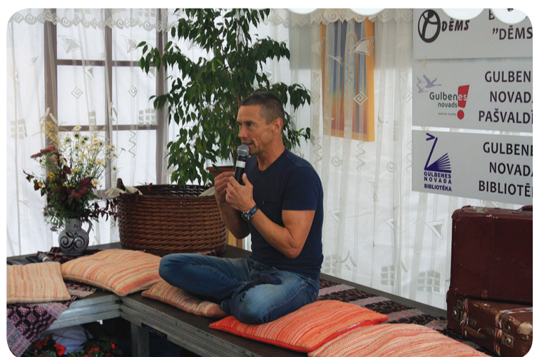
Gulbenes novada pašvaldības saimniecības daļas vadītājs, kā arī vienkārši veselīga dzīvesveida piekritējs dalās ar saviem veselīgas dzīves principiem