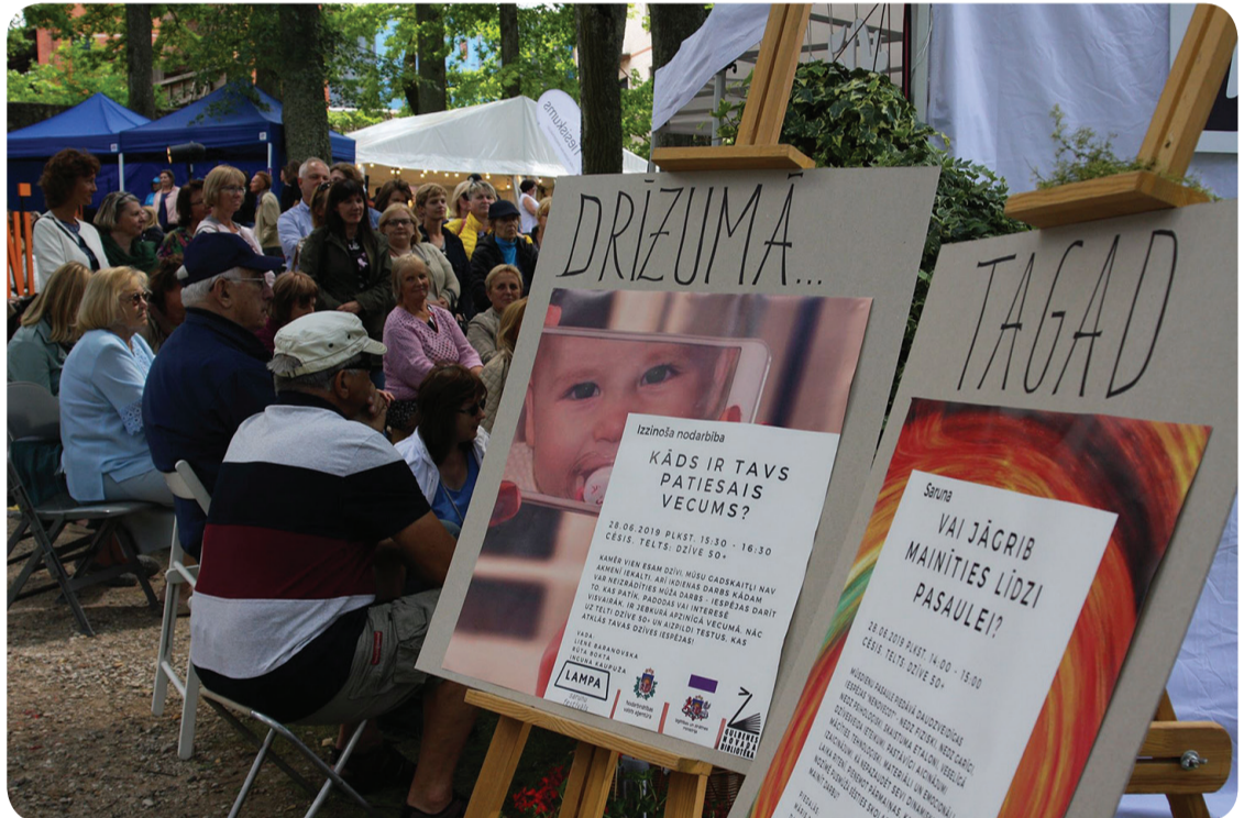
28. un 29. jūnijs teltī "Dzīve 50+" aizritēja dinamiskās sarunās par to, kas būtisks mūsdienu senioriem - mācīšanos, pārmaiņām, mīlestību, brīvprātīgo darbu un daudz ko citu