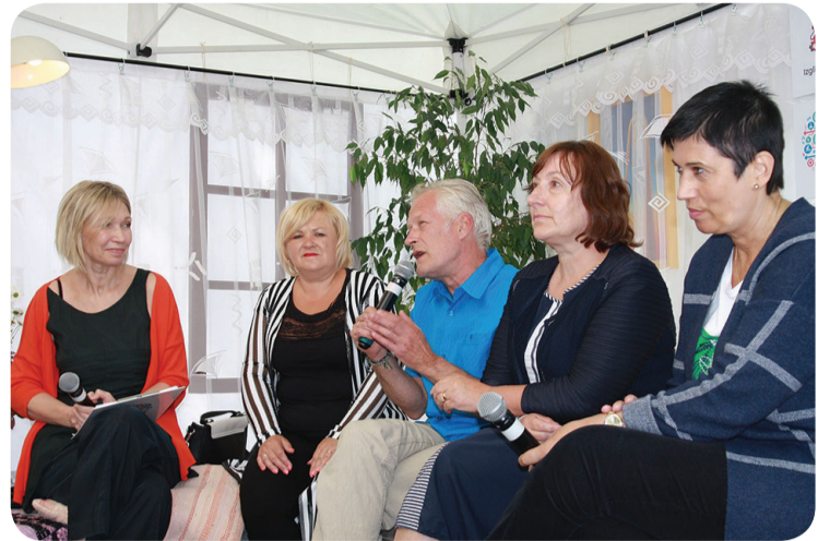
Gulbenes novada bibliotēkas direktore piedalās diskusijā "Vai jāgrīb mainīties līdzī pasaulei?"