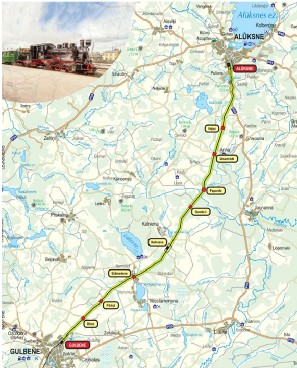
Attēls 3 Maršruts Gulbene - Alūksne

Maršrutā ir noteiktas 10 pieturvietas. Pieturas punktos Birze, Pūriņi, Dunduri, Pāpārde un Vējiņi vilciens apstājas tikai pēc pieprasījuma - ja pieturvietā redzami pasažieri vai kāds no vilcienā braucošajiem pasažieriem vēlas izkāpt.