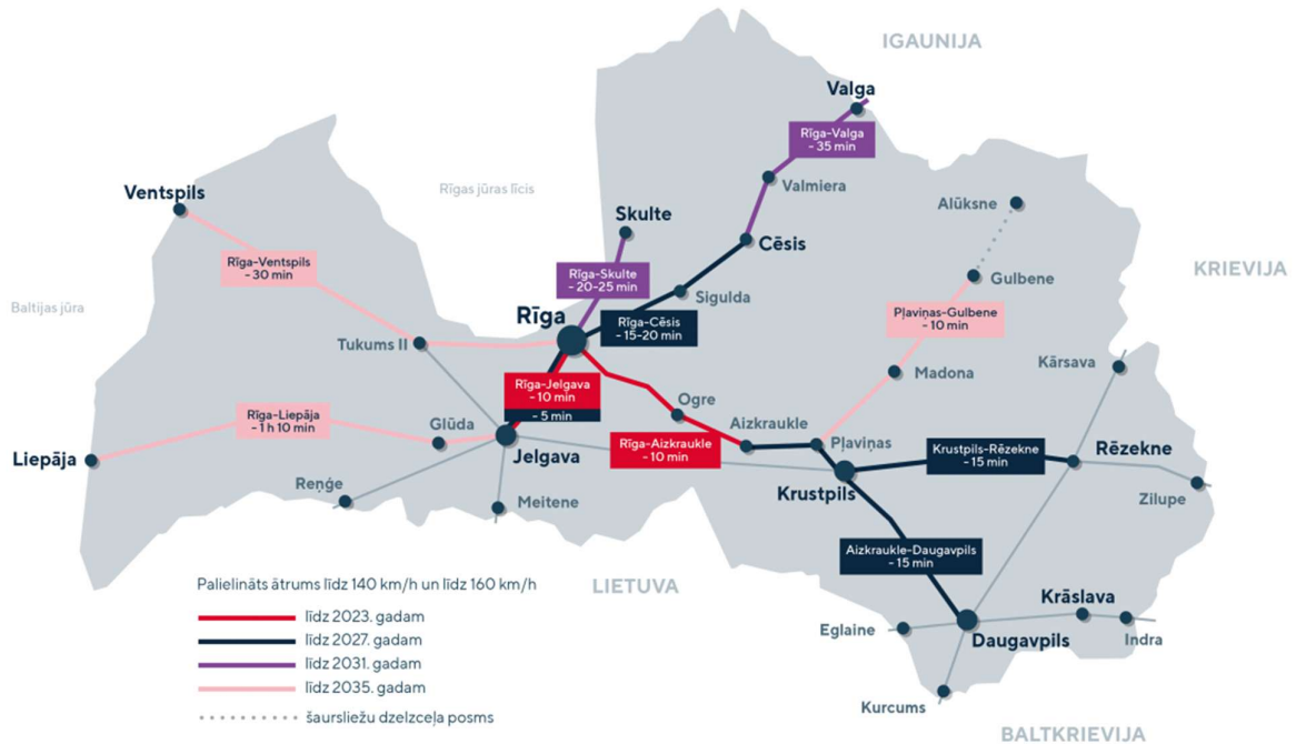
Attēls 4. Latvijas dzelzceļa infrastruktūra pasažieru vilcieniem

Datu avots: Latvijas Dzelzceļš, https://www.ldz.lv/lv/LDz-infrastruktur-as-ilgtermi-na-attistibas-prioritates