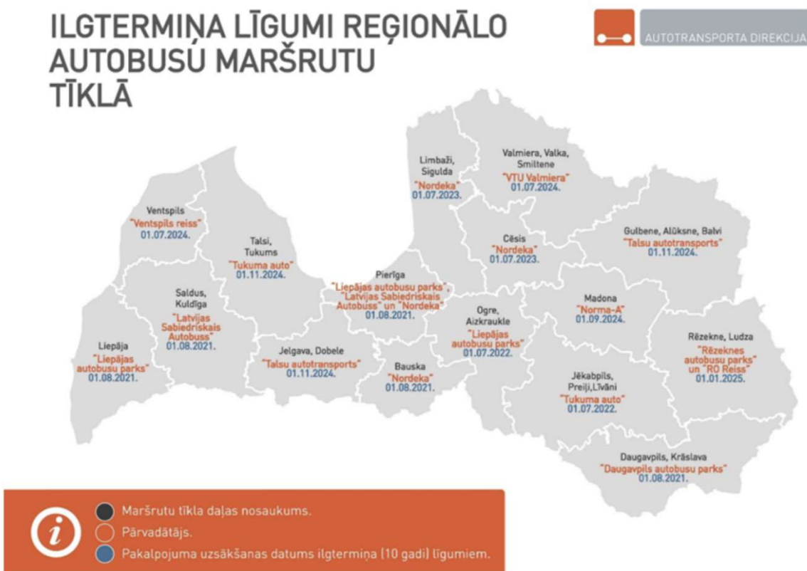
Attēls 4. Pakalpojumu sniedzēji reģionālo autobusu maršrutu tīklā Latvijā

Datu avots: ATD, https://www.atd.lv/lv/jaunumi/autotransporta-direkcija-ir-nosl%C4%93gusi-ilgtermi%C5%86a-l%C4%ABgumus-par-pasa%C5%BEieru-p%C4%81rvad%C4%81jumu