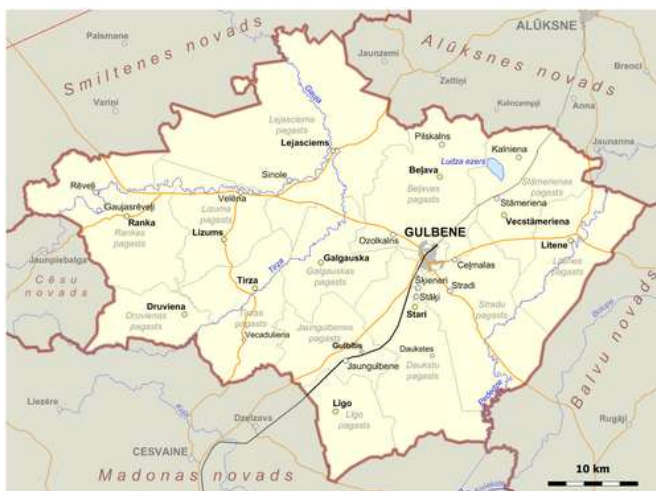
Attēls 3. Gulbenes novada administratīvā teritorija

Attēlā zemāk ir redzama Gulbenes novada administratīvā teritorija.