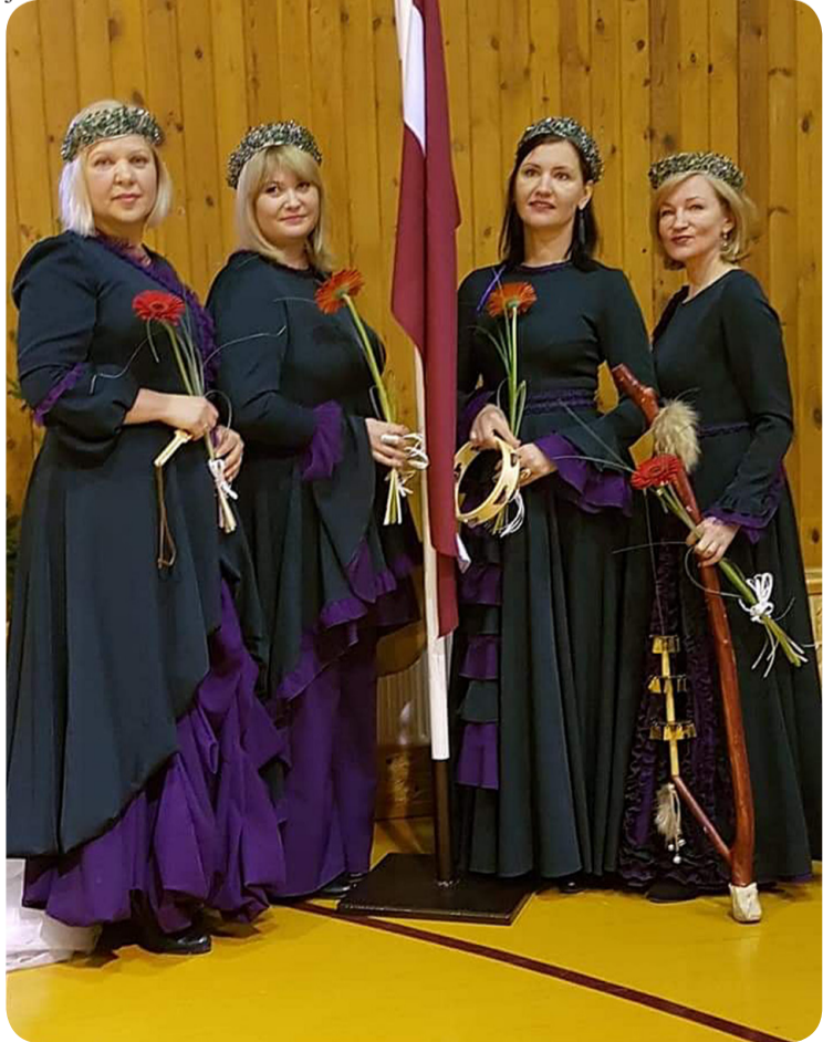
Folkgrupa “Dadzēs” ir otrā ģimene

Tā nu sanāk, ka savā mūžā piedzīvojam pirmo pasaules mēroga krīzi ar tik nopietnām sekām. Iespējams, ka arī šīm pārmaiņām ir kāds vēstījums, kas mums katram jānākas jomasīt.”