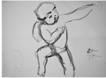
Amora skulptūras skice

Lai sekotu līdzi teritorijas apmeklēšanai, tajā tiks izvietots apmeklētāju plūsmas skaitītājs.