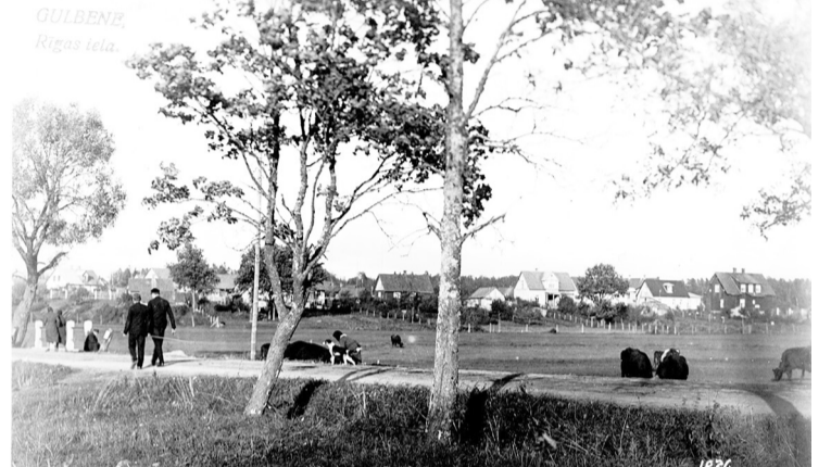
Gulbene. 20.gs. 20.-30.gadi.