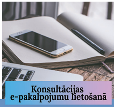
Konsultācijas e-pakalpojumu lietošanā