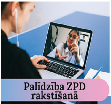
Palīdzība ZPD rakstīšanā

Gulbenes novada bibliotēka aicina iedzīvotājus būt atbildīgiem par savu un līdzcilvēku veselību, ievērojot visus noteiktos Slimību profilakses un kontroles centra ieteikumus!