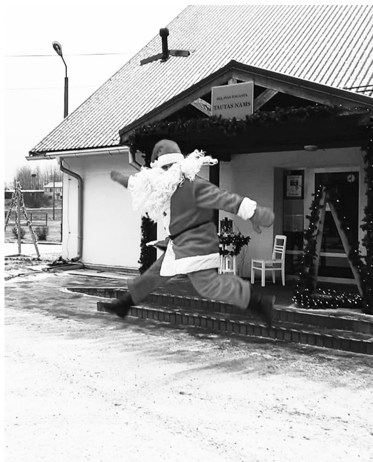
Gulbenes novada Kultūras pārvaldes kolektīvs

Radošas izdomas pilns, daudzšķautņains un azartisks – tāds 2020. gads bija Gulbenes novada kultūras dzīvē. Kultūras nozare bija iemesta vāveres ritenī, kas apstājās neilgajos brīžos, kad varējām tikt klātienē pasākumos.