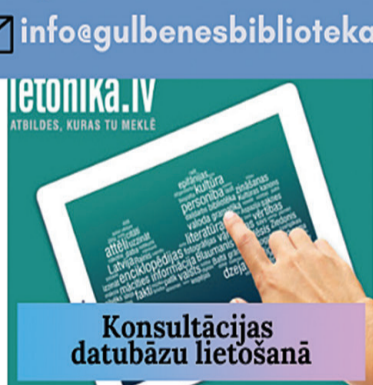
Konsultācijas datubāzu lietošanā