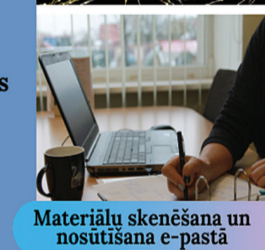
Materiālu skenēšana un nosūtīšana e-pastā