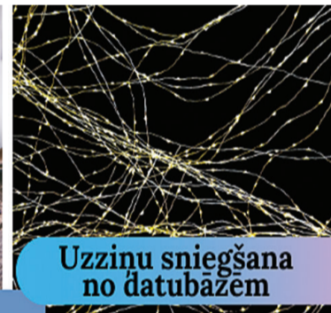
Uzziņu sniegšana no datubāzēm