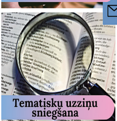
Tematisku uzziņu sniegšana