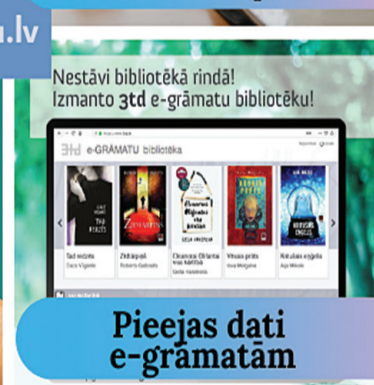
Pieejas dati e-grāmatām