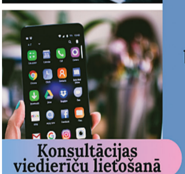
Konsultācijas viedierīču lietošanā