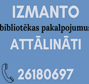
IZMANTO bibliotēkas pakalpojumus ATTĀLINĀTI 26180697