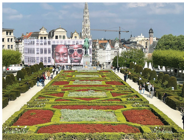
Ikvienam kā ar magnētu piesaista pompozā un iekārotā Eiropas Savienības galvaspilsēta - Brisele.

mini, uzzini” un Eiropas Parlamenta deputātam Ivaram Ijabam.