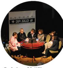
Darbnīcas, 30. jūlijs

Porcelāna mākslas seminārs „Straume un putni” (11.-16.07.), seminārs - lina drukas darbnīca „Priekšauts” (18.-23.07.), gobelēna aušana uz vertikālajiem auzmajiem stāviem „Zvaigžņu siets” (25.-30.07.).