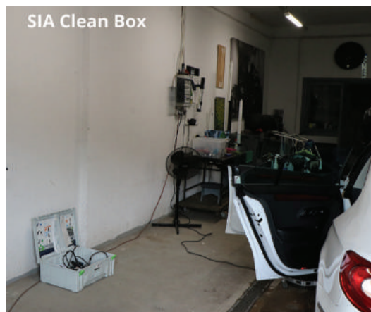
SIA Clean Box

Pārbaudes tiek veiktas, lai izvērtētu uzņēmuma darbības atbilstību projektu konkursa nolikumā noteiktajām prasībām. Pašvaldība 3 (trīs) gadus no līguma noslēgšanas brīža veic uzraudzību un pārbaudes granta saņēmēja darba vietā. Notiek tikšanās ar uzņēmēju klātienē, lai pārliecinātos par komercdarbības norisi, iegādāto materiālo vērtību atrašanās komercdarbības veikšanas vietā.