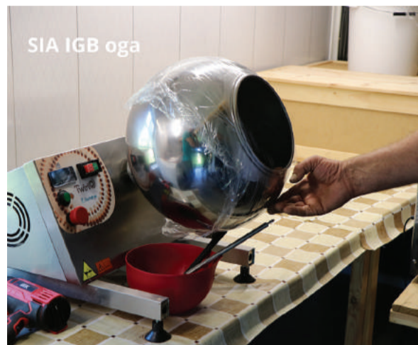
SIA IGB oga

SIA Clean Box veic mīksto tekstilizstrādājumu un transportlīdzekļu tīrīšanu. 2020.gadā startēja granta konkursā, komisija deva pozitīvu vērtējumu un piešķīra granta finansējumu 4964,00 EUR. Pakāpeniski un lēnām tiek meklēti labākie risinājumi, lai īstenotu savu ideju un veiksmīgi varētu attīstīt uzņēmējdarbību.