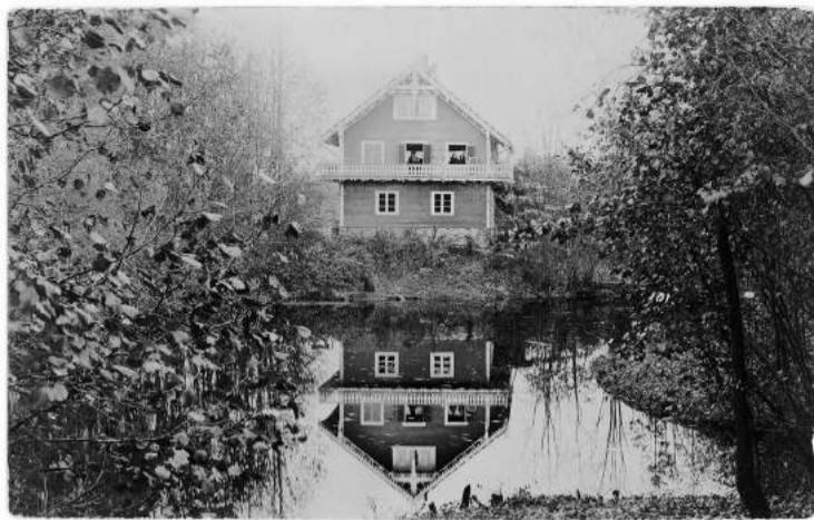
Vecgulbenes muižas Vešūzis. 20.gadsimta sākums.

Kāds ceļinieks 1928. gada laikrakstā “Gulbenes Ziņas” stāsta: