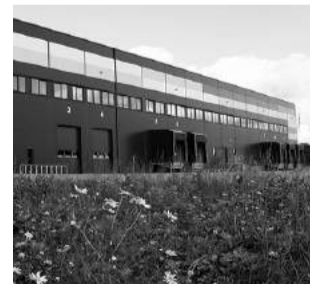
NACIONĀLAIS ATĪSTĪBAS PLĀNS 2020 EIROPAS SAVIENĪBA Eiropas Reģionālās attīstības fonds