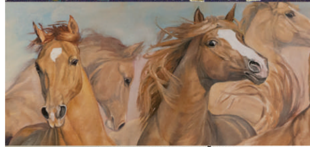
Karabahas zirgu gleznas - Dace Štrausa