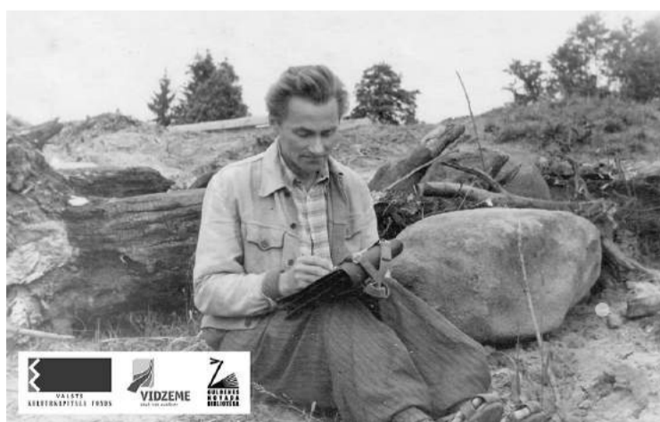
Vilis Zvaigznīšis 20. gs. 50. – 60. gados.

Tēlnieks, literāts, pēc izglītības inženieris-ķīmiķis Vilis (Vilhelms) Zvaigznīšis dzimis Lizumā 1913.