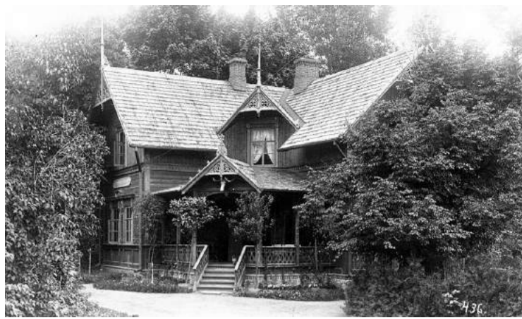
Vecgulbenes muižas dārznieka māja, 20.gs. 20-tie gadi