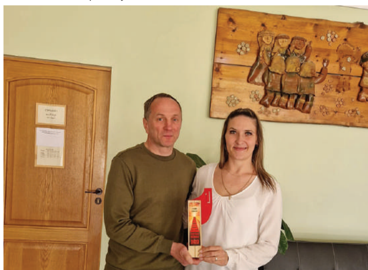
Izaicinājumā "Kilometru cīņas" par uzvarētājiem ar pieveiktiem 4208,55 kilometriem kļuva Lizuma pagasts.