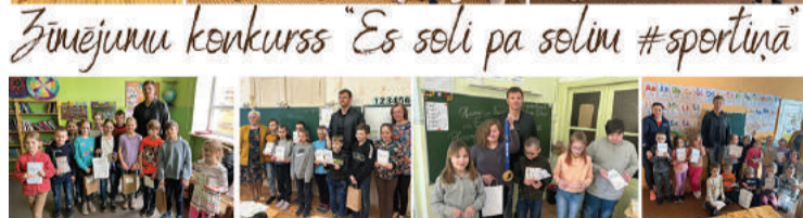
Radošajā aktivitātē - zīmējumu konkursā "Es soli pa solim #sportiņā" no Gulbenes novada piedalījās 97 bērni.