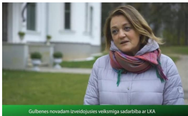
Gulbenes novadam izveidojusies veiksmīga sadarbība ar LKA