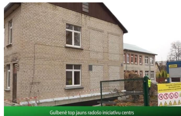
Gulbenē top jauns radošo iniciatīvu centrs