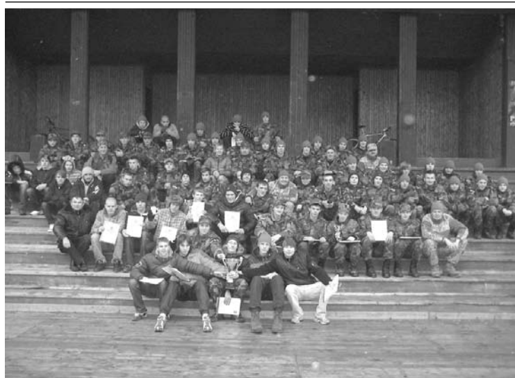
Pēc padarīta darba – kopēja fotogrāfēšanās

Lāsma Gabduļina, 208.Lejasciema vienības vecākā referente jaunsargu izglītošanas jautājumos