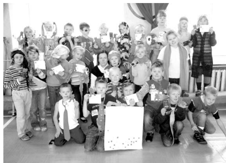
Visi ir kļuvuši par pilntiesīgiem Gulbenes vidusskolas skolēniem.

Ielidojot lidmašīnai iesvētāmo klasē ar aicinājumu doties uz skolas ēdnīcu, svētki varēja sākties. Pirmais uzdevums bija talismanu izdomāts – kopīgi izdzert litru piena. Viņi to paveica! Vienotības gars bija acīm redzams. Miesassargu pavadīti, pirmklasnieki tika vesti pa vietām, kur līdz šim vēl nebija bijuši, uz nākošo pārbaudījumu. Otrajā pārbaudījumā bija jānonāk no vieniem drošības vārtiem uz otriem. Lai to paveiktu, bija jāpārvar grūtības: jāizlozē starp saviņķerētiem diegiem un jāliien cauri tunelim. Kad grūtības garām, varēja ķerties pie patīkamā, balvu pasniegšanas ceremonijas. Kā jau slavenības, viņi ar stilistu palīdzību tika sapesti un devās uz „Oskara” cere-