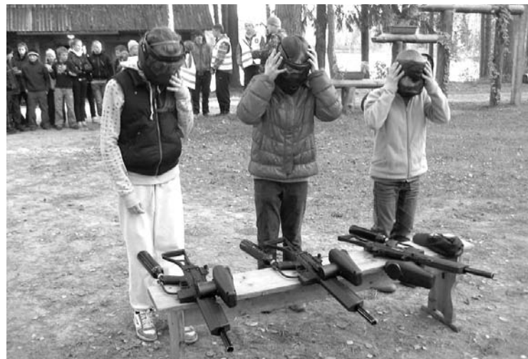
Dueļos meitenes jaunsardzes neatpaliek no zēniem