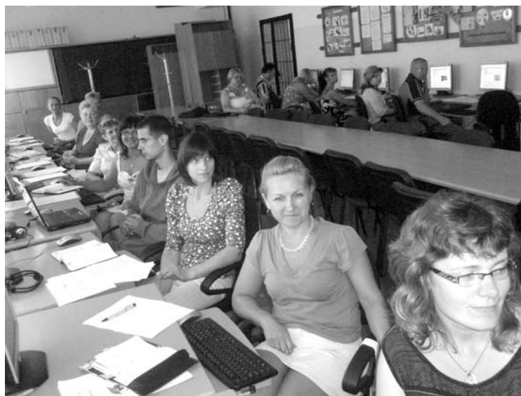
Skolotāji apgūst iemaņas darboties MOODLE vidē

Jauninājumi darbā skolotājam nepieciešami, jo mūsdienu interneta straujās pārmaiņas prasa no pedagoga apgūt jaunās prasmes darbā ar datoru mūsdienu IKT skatījumā. Arī pedagogam jābūt konkurences spējīgai personībai – radošam, elastīgam savā domāšanā un darbībā. Tāpēc Rankas arodvidusskolas skolotāji, kas iesaistījušies ESF projektā, apguva prasmes darboties MOODLE sistēmā. Tā ir populārākā