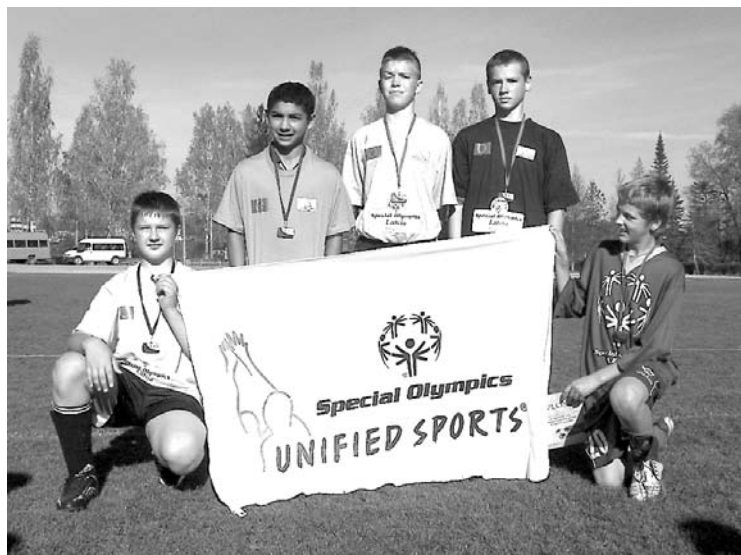
Uzvarētāja komanda ar Special Olympics Unified Sports karogu

Kopvērtējumā sacensībās uzvarēja Dzirciema komanda, bet Sveķu skolas komanda izcīnīja