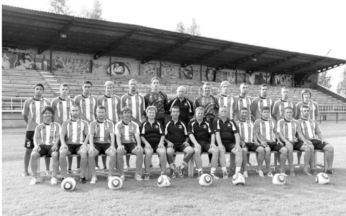
FB GULBENE-2005 ceļš līdz uzvarai čempionātā

Latvijas futbola augstākajā sabiedrībā. Un pirmo rekordu, kuru gribētos labot virslīgā – skatītāju apmeklētība mājas spēlēs. Dabīgi, jo komanda labāk