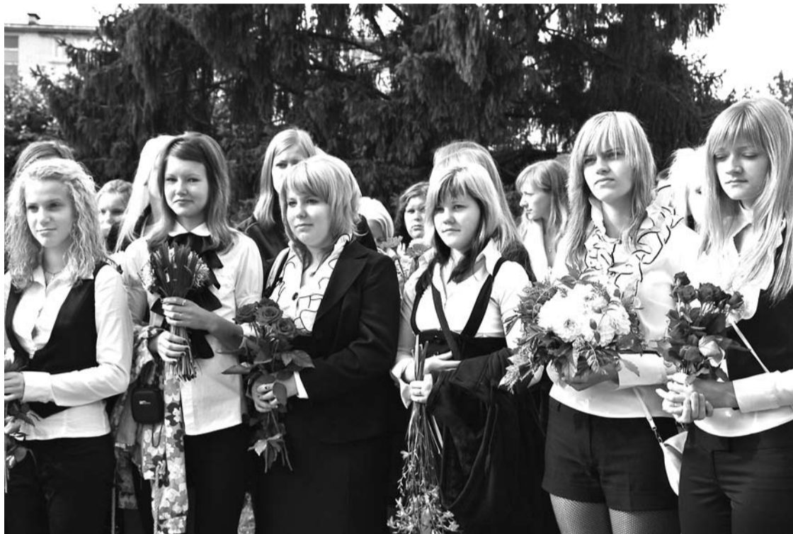
1.septembris - laiks ziediem un jaunam mācību gadam.

Izglītības un zinātnes ministrija ir paredzējusi, ka 2010./2011. gada septembrī – decembrī skolēnam „sekos” tikpat liels finansējums kā 2010.gada pirmajos 8 mēnešos atbilstoši „Likumam par valsts budžetu 2010.gadam”. Tas nozīmē, ka skolās, kur bērnu skaits ir pietiekošs, būs arī pietiekošs finansējums skolotāju algām. Lai gan IZM vēl joprojām (8.septembrī) nav nosaukusi valsts mērķdotācijas apjomu pedagogu algām, novadā šis finansējums tiks sadalīts atbilstoši novada domē apstiprinātajai kārtībai pedagogu mērķdotācijas sadalei Gulbenes novadā. Katrai izglītības iestādei atbilstoši skolēnu skaitam katrā pakāpē (pirmsskola, sākumskola, pamatskola un vidusskola) tiks piešķirta naudas summa, kuru izglītības iestāde sadalīs, ievērojot normatīvajos aktos noteikto kārtību, kā arī katras izglītības iestādes prioritātes.