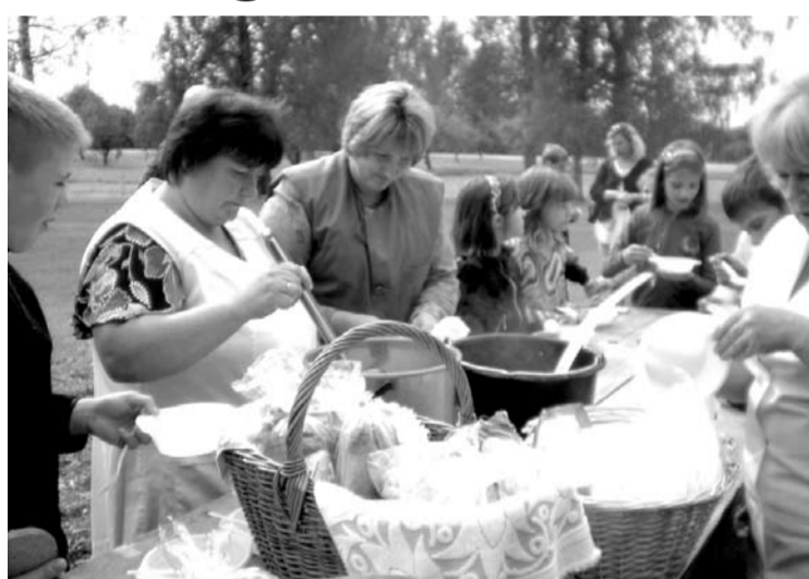
Kopīgas pusdienas jaunajā atpūtas vietā pie skolas

Mazie skolēni un pirmsskolas grupiņu bērni īpaši priecājās par noslēpumaino Rūķi skolas logā. Viņš visu vasaru rakstījis dienasgrāmatu, no kuras mēs uzzinājām par to, kas ir noticis skolā pa vasaru. Trenējās "Buki", notika nometnotāju kursi, darbojās 3.Tirzmaliešu saietā radošās darbnīcas un nometne " Kopā jautrāk 2010", katru otrdienu un ceturtdienu pagasta jaunieši pulcējās uz futbola spēlēm, trenējās treniņu zālē. Vecāku iniciatīvas grupa