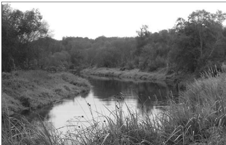
Gauja rudenī netālu no Linupītes

Atvērta materiālus sagatavoja Ilona Vītola