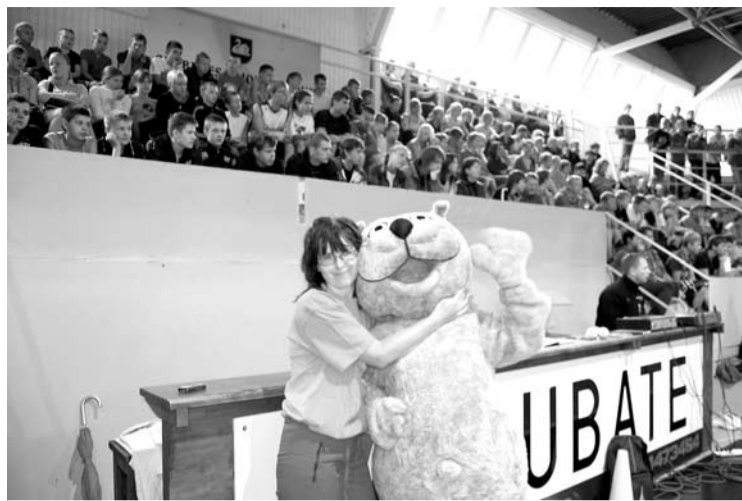
Kaķis īpašā veidā visu laiku palīdzēja saviem draugiem pirmklasniekiem

Tikpat ātri, cik pienāca rudens, arī mūsu skolā atausa 3. septembra rīts. Gaidītās saules vietā gan uzdarbojās lietus, bet