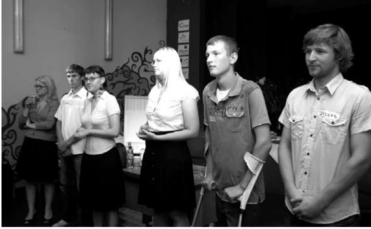
Forumteātra metodes iedzīvināja Gulbenes novada jaunieši