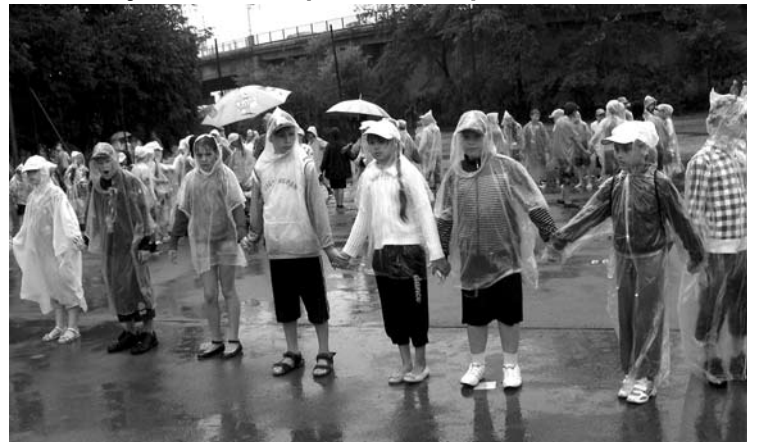
Mēģinājumā Daugavas stadionā