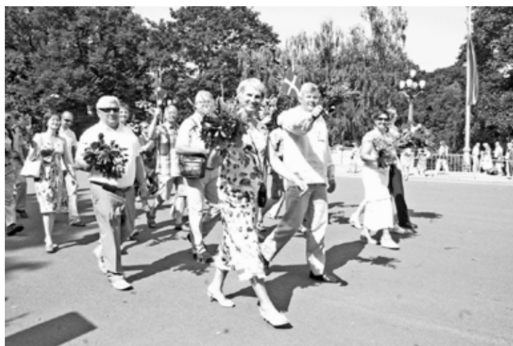
Kopā ar Gulbenes novada jauniešiem svētku gājienā Rīgā, 10. jūlijā.

Tas viss arī parādīsies novada attīstības programmā, ko pašlaik izstrādājam. Piemēram, ļoti ceru, ka nākotnē sociālais darbs būs vērts ne tikai, lai palīdzētu mazturīgākajām ģimenēm, bet arī mēs varētu atbalstīt gan gudrus un talantīgus jauniešus, gan labus pedagogus vai labas ģimenes. Esam saņēmuši ainaviskos novads, taču man gribētos, lai strādājam vēl vairāk, jo, manuprāt, trūkst teritorijas vienota vizuālā veidola jeb tēla. Uzskatu, ka katrā pagastā ir jāsauglabā pagastam raksturīgās kultūras un vēsturiskā mantojuma tradīcijas un pašdarbība. Daudz jādara sporta nozarē, jo mums ir gan cilvēkresursi, gan infrastruktūra. Līdz galam jāsakārto izglītības sistēma. Novadā ir spēcīga mākslas skola, mūzikas skola un sporta skola, kur mācās talantīgi bērni. Savukārt Gulbenes bibliotēka