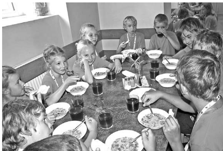
Par ēdināšanu un apetīti gulbenieši nesūdzējās