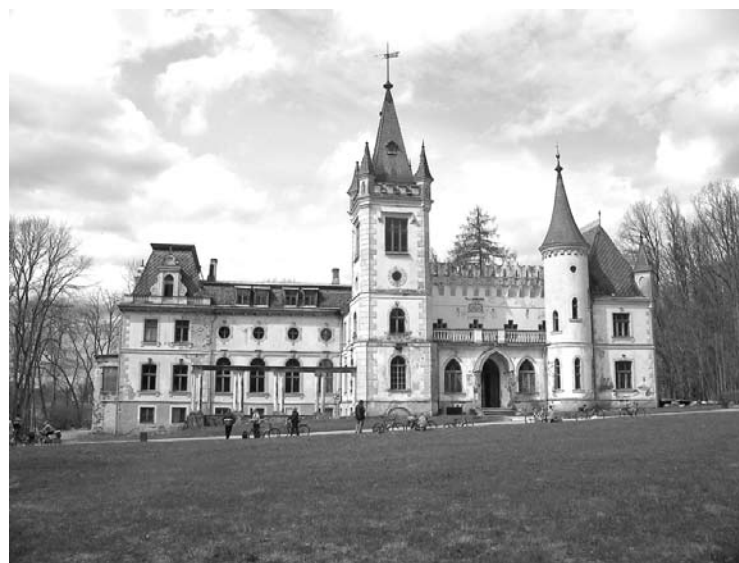
Stāmerienas pils

iespēju robežās cenšas lobēt A.Vīcupu. Viņa arī pierakstīta vienā no Stāmerienas pils kompleksa ēkām. Tur pierakstīta arī Lolita Dundure ar savu meitu.