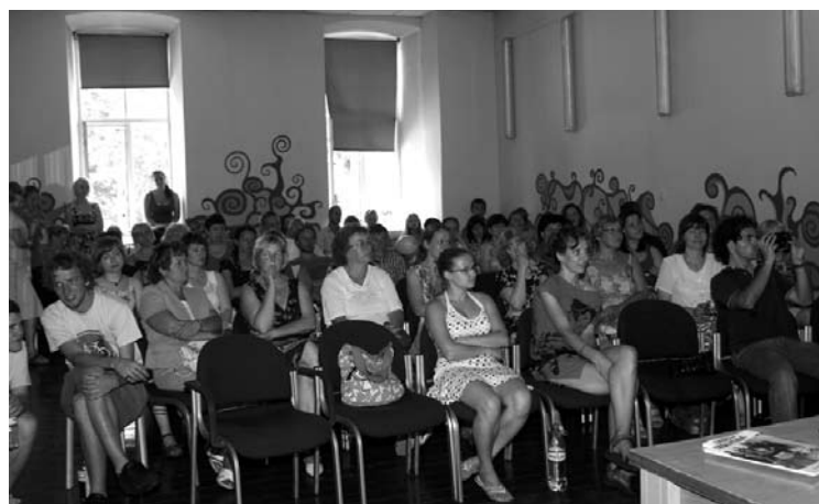
Seminārs par alkoholismu darbā un ģimenē pulcēja daudz interesentu