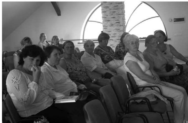
Seminārā par nodarbinātību un cilvēkresursiem pulcējās novada amatnieki un lauksaimnieki