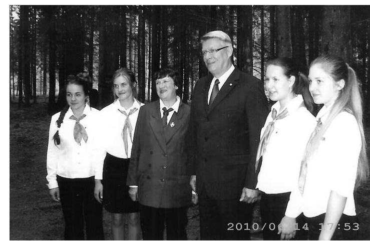
Gaidas kopā ar Valsts prezidentu Valdi Zatleru

Tāpat mums ļoti patika „Skrējiens pēc nezināmā”. Īpaši jaukas bija naksniņas jeb sarunas pēc vakariņām pie ugunsкура,