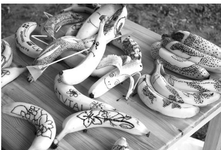
Jauniešu centra "Pulss" banānu Tatroo