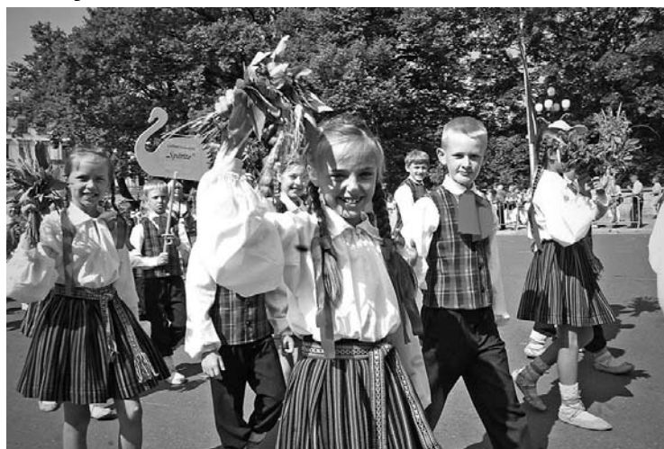
Gulbenes vidusskolas deju kolektīvs “Spārīte”