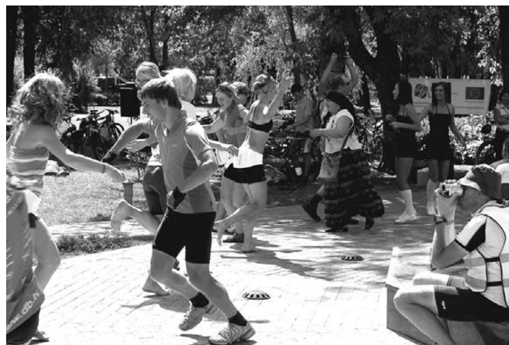
Griežoties dejā, ir pazudis pat nogurums.

Velomaratons sākās 11. jūlijā un noslēdzās 24. jūlijā Siguldā.