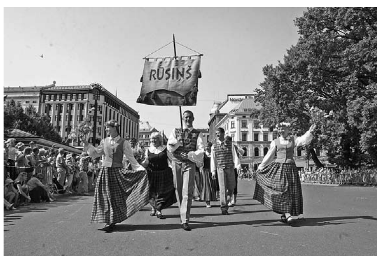
Gulbenes novada valsts ģimnāzijas deju kolektīvs “Rūsiņš”