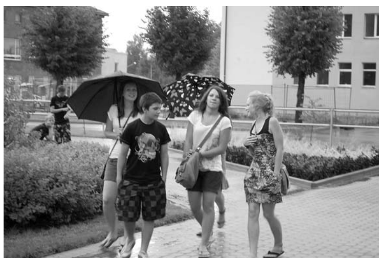
Spītējot piektdienas pēcpusdienas lietum, jaunieši turpināja savas svētkus