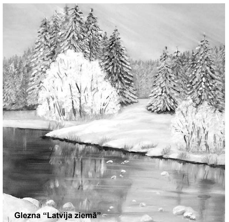
Glezna "Latvija ziemā"