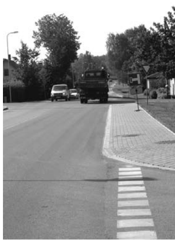
Ielu rekonstrukcija turpinās.