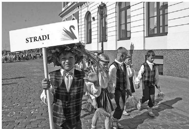
Stradu pagasta pārvaldes mazie dejojāši ir gatavi svētkiem