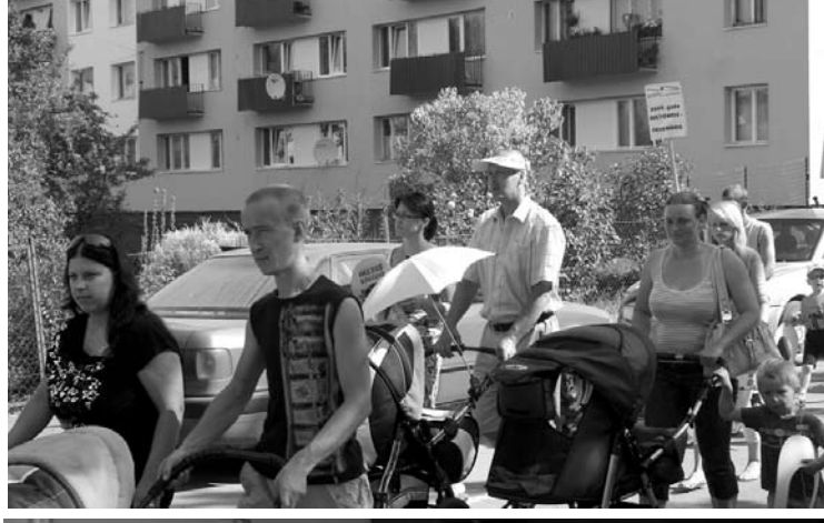
Spītējot saules svelmei, sestdienas rītā savā gājienā devās pilsētas mazuļi