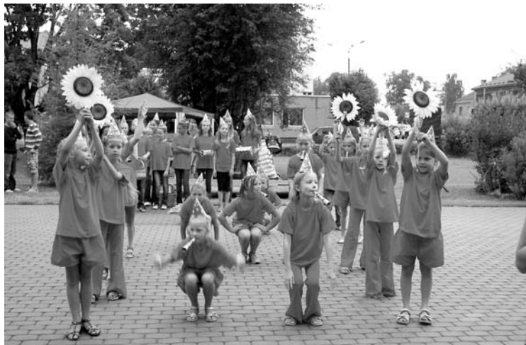
Bērzu pamatskolas bērni klātesošos priecēja ar ugunīgiem tērpiem un nīprām kustībām