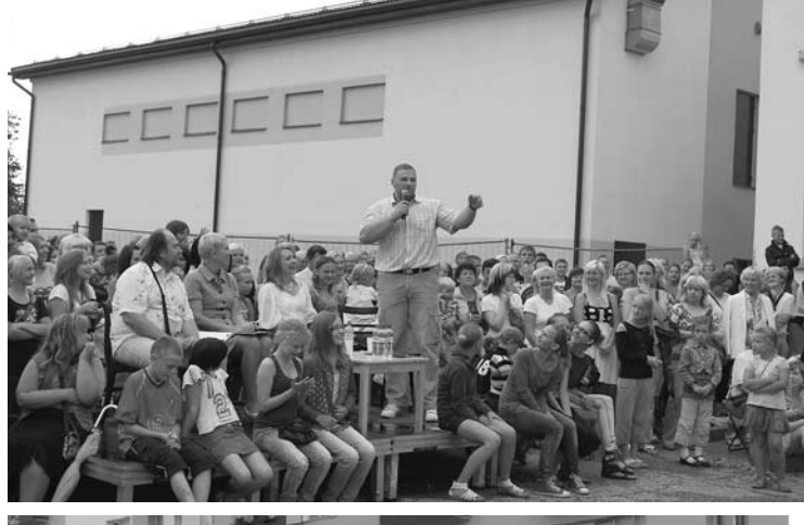
Skatītāji ar pozitīvām emocijām vēroja konkursa "Meklējam talantu" koncertu