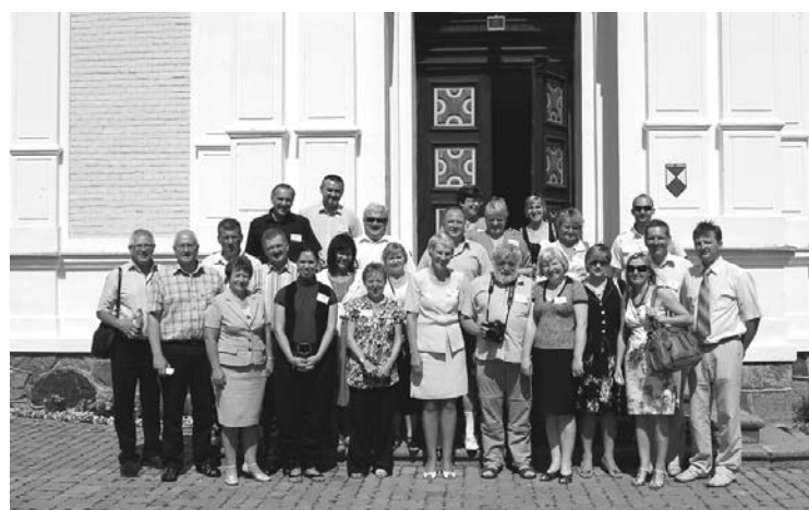
Ciemiņi priecājās par skaisto Sv. Nevas Aleksandra pareizticīgo baznīcu, meklējot kalnu kristālu mirdzumu baznīcas krustu smailē.

Otrs mērķis - iepazīstināt ārzemju sadarbības partnerus ar mūsu kultūras mantojumu Dzies-