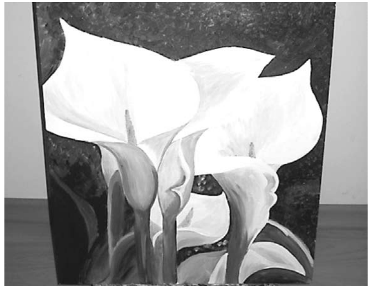
Solveigas Kļaviņas glezna "Kallas"

- Jā, daudzējādā ziņā, piemēram, saprotu, ka dzīve laukos ir ekskluzīva iespēja. Par iespēju dzīvot tīrā, ekoloģiskā dabas vidē, klusumā, jāmaksā ar dzīves dārdzību. Internets, pasta piegādes, preces veikalos ir dārgākas nekā lielpilsētā, sabiedriskā transporta gandrīz nav, lauku mājā auto ir dzīves nepieciešamība numur viens, daudzas preces, piemēram, man gleznošanai nepieciešamās krāsas vai otas varu nopirkt tikai Rīgā. Darbu grūti atrast, tas ir tālu. Bet atmiņā sakrājušies dažādi iespai-