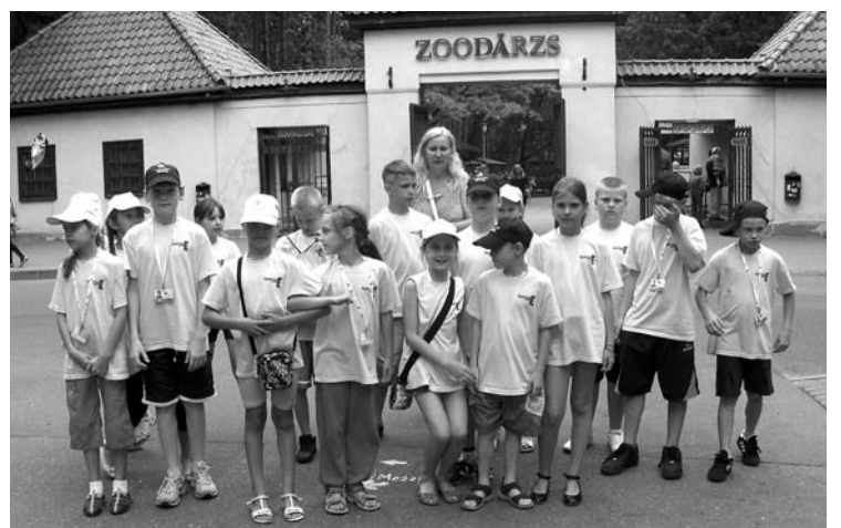
Izklaides Rīgas zoodārzā