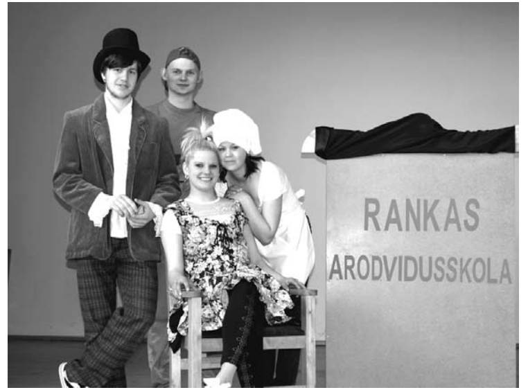
Skolas audzēkņi reklamē apgūstamās profesijas

23. jūnijā, tieši Līgo dienā Rankas arodvidusskolas aktu zālē pateicības vārdus skolai, vecākiem, skolotājiem un darbiniekiem savā izlaidumā sacīja 3. grupu absolventi. Skolu šogad absolvēja 55 jaunieši pavāra, būvizstrādājumu galdnieka, pavāra palīga un galdnieka palīga profesijā. Jaunieši, kuri izlēmuši iet profesionālās izglītības ceļu, arī savas darba gaitas var sākt salīdzinoši agrāk, ātrāk kļūst patstāvīgāki, ātrāk sevi nodrošina ar iztikas līdzekļiem.