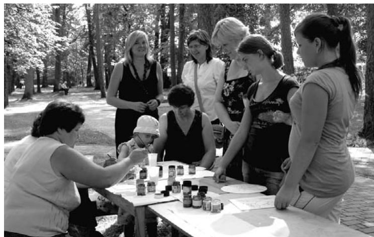
Amatnieku tirdziņā bija iespēja ne tikai iegādāties, bet meistarot pašiem