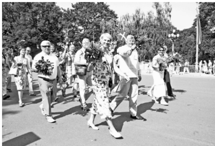
Gājienā dodas arī Gulbenes novada domes vadība