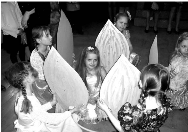
Mūzikls „Ikstīte” iepriecināja ikviena sirdi

Taču šī nebija tikai svētku diena. Pirms apsveikuma koncerta un mielasta vecāki strādāja darba grupās - pieredzējušu pedagogu vadībā iepazīs ar stundās izmantojamajām mācību metodēm. Stundās vecāki iejutās „skolēnu ādā” un akadēmiskajās 40 minūtēs apguva kādu tēmu. Literatūras stundā skolotājas T.Voveres vadībā vecāki apguva jēdzienu radošums, klausījās mūziku, sacerēja, darbojās