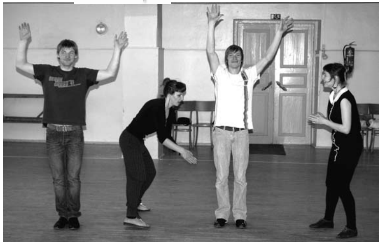
Forum teātra apmācības Kalnienā

Lai arī pēc 50 gadiem būtu Gulbenes novads ar ģimenēm, atpūtas iespējām, skaistām ainavām un darba iespējām, jārikojas jau šodien. Projekta ietvaros organizāciju „Kapo” (Kalniena), „Pulss” (Lejasciems), „Dēms” un „Bāze” (Gulbene) jaunieši izvēlējušies izpētīt konkrētu sfēru saistībā ar samērīgu patēriņu. Atkritumi! Neskan īpaši pievilcīgi... Taču ikviena cilvēka – patērētāja - ikdienā atkritumi visdažādākajās to izpausmēs IR. Vai iedomājies, ka vismaz trešā daļa no taviem ikdienas pirkumiem nonāk miskastē? Un kas notiek ar miskasti? Vai tās saturs tiek otrreiz izmantots vai vienkārši „norakts” mūsu skaistajā, zaļajā zemītē? Jaunieši projektā pēta savu pašvaldību pieredzi, iedzīvotāju