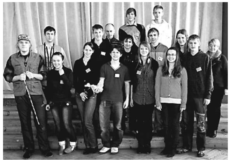
Dabaszinātņu dienā Cēsīs