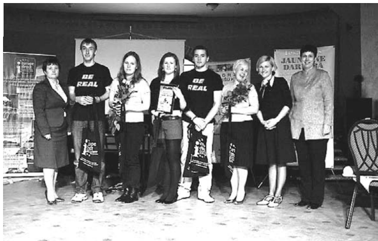
Konkursa 1.vietas ieguvēji - Lizuma vidusskolas komanda

2.vidusskolas, Gulbenes novada valsts ģimnāzijas un Lejasciema vidusskolas komandas. Viena komanda no uzņēmuma SIA “Rubate” saņēma arī īpašu specbalvu - “Papildizglītības iespējas 100 LVL vērtībā”. Jāteic tā, ka nopietns konkurss ir noslēdzies un ir saņemtas arī labas balvas – divi braucieni jauniešu apmaiņās uz kādu no Eiropas Savienības valstīm, iespēja apmeklēt ES māju un improvizācijas teātri „Hamlets” Rīgā, aktīvās atpūtas iespējas „Xparkā”, kā arī ielūgumi ar iespēju apmeklēt kādu no muzikālajiem un kultūras pasākumiem Gulbenē.