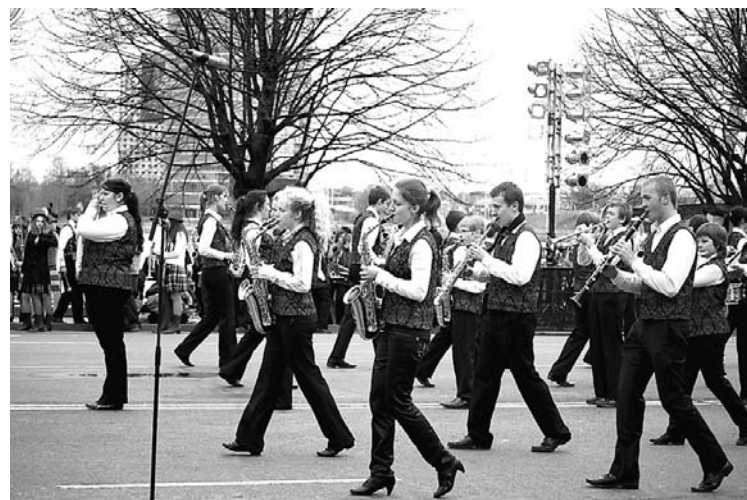
Pūtēju orķestris Daugavas krastmalā 4.maijā