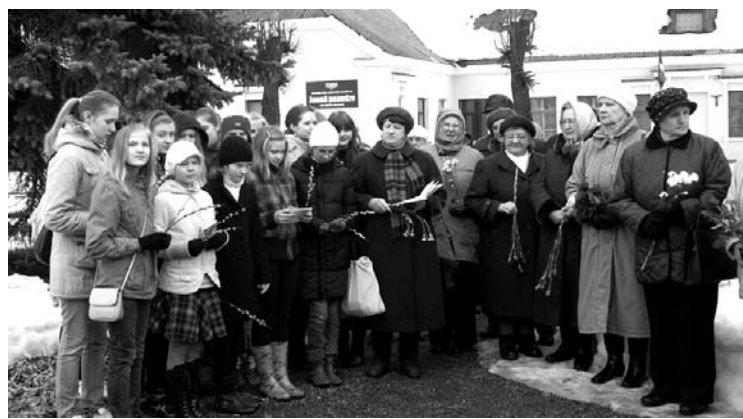
25.marta Komunistiskā genocīda piemiņas pasākumā Gulbenē