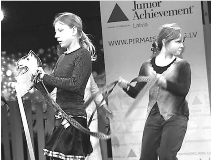
Uz Dailes teātra skatuves 5.klases biznesa pasaka

Tirzas pamatskolas skolēni turpina mācīties uzņēmējdarbību, realizējot projektu „Pastāvēs, kas pārvērtīsies” (finansāli atbalsta SFL „Pārmaiņu iespēja skolā”). Ko esam paguvuši izdarīt?