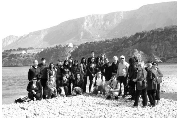
Projekta dalībnieki Tirānijas jūras krastā Sicīlijā

Pavisam projektā darbojas 200 skolēni un 15 skolotāji.