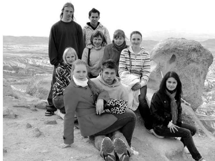
Gulbeniešu grupa Cappadocia kalnos Turcijā

Gulbenes 2.vidusskolas 12.klašu jauniešu grupa no 2. līdz 11.aprīlim devās apmaiņas programmā „Jaunatne darbībā” uz Turcijas pilsētu Kirsehiru. Skolas jauniešu iniciatīvu grupa nodibinājusi sadarbību ar Kirsehiras jauniešiem kopš projekta Spānijā. Jau vairākus gadus sadarbojamies izvēloties tēmas, kas būtu interesantas kopīgām diskusijām.