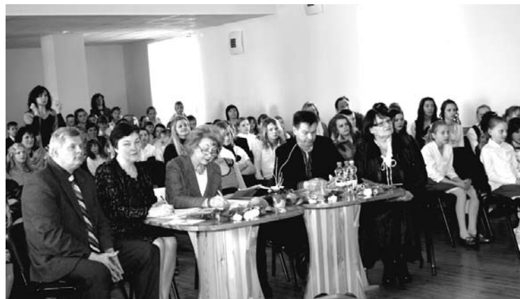
Novada skolu vokālo ansambļu skate „Balsis”

Nodaļas kultūras galvenās speciālistes E.Siļķēnas vadībā sastādīts 2010.gada Gulbenes novada kultūras pasākumu plāns, sagatavots budžeta plānojums novada svarīgākajiem pasākumiem un norisēm: amatiermākslas skatēm, izglītojošiem semināriem, māksliniecišķām aktivitātēm. 2010.gadā ir izstrādāta vienota atalgojuma sistēma novada kultūras namu/tautas namu un pagastu kultūras dzīves organizatoriem. Pašreiz tiek veidota vienota algu sistēma arī amatiermākslas kolektīvu vadītājiem. Tiek organizētas amatiermākslas kolektīvu skates, kā, piemēram, vokālo ansambļu skate Rankā, kas guva plašu