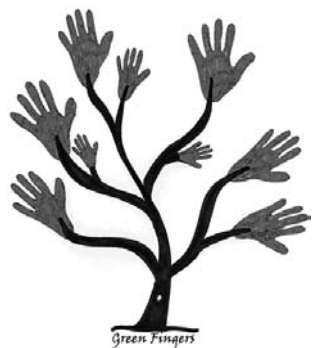
Biedrība „Gulbenes lauksaimnieku biedrība”

„Gulbenes lauksaimnieku biedrība” no 2009. gada augusta līdz 2011. gada jūlijam realizē projektu „Green Fingers” (Zaļie pirkstiņi). Projekta mērķis ir popularizēt bērnu un jauniešu vidū „zaļo domāšanu”, attīstot iemaņas darbam augkopībā un dārzkopībā. Lai saglabātu jaunajā paaudzē interesi par zemi, zaļo dabu, veselīgu pārtiku, svarīgi ir tieši, kā pieaugušie, vecāki un vecvecāki nodod savas zināšanas saviem bērniem. Tādēļ projekta galvenās aktivitātes ir vērstas uz zināšanu apkopošanu un pieredzes apmaiņu starp pieaugušajiem, kuri strādā ar bērniem un jauniešiem. Tāpat mūsdienās ir svarīgi, ka arī pieaugušajiem un senioriem ir iespēja mācīties un papildināt savas zināšanas mūža garumā, kas ļauj viņiem būt dzīves un procesa aprītē.