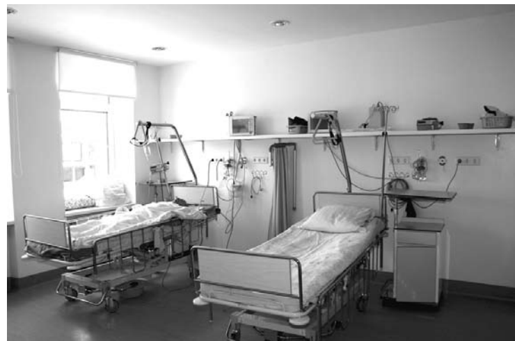
Reanimācijas nodaļa Gulbenē

Mums ir jābūt pieņemti optimistiskiem. Ja doma par apvienību jau sākotnēji ir bijusi pozitīva, tad arī rezultātam tādām jābūt. Ir jārealizē līdz galam iniciatīva, ka no divām mazām lauku slimnīcām izveidojas viena stipra apvienība. Esam pašā ceļa sākumā. Nereti valda uzskats – ja divi apvienojas, tad beigās lielākais „apēd” mazāko. Gribu iebilst šādam stereotipam. Apvienībā esam nolēmuši, ka mēs ar savu darbu pierādīsim, ka ir iespējami arī citi varianti: attīstība, sadarbība, kvalitāte, pieejamība. Mūsu kompromisa variants ir divu slimnīcu saplūšana uz līdzvērtīgiem noteikumiem, ne pievienošanās. Lēmumus valdē pieņemam vienbalsīgi. Ja kāda viedoklis ir atšķirīgs, tad lēmums netiek pieņemts, bet tiek meklēti