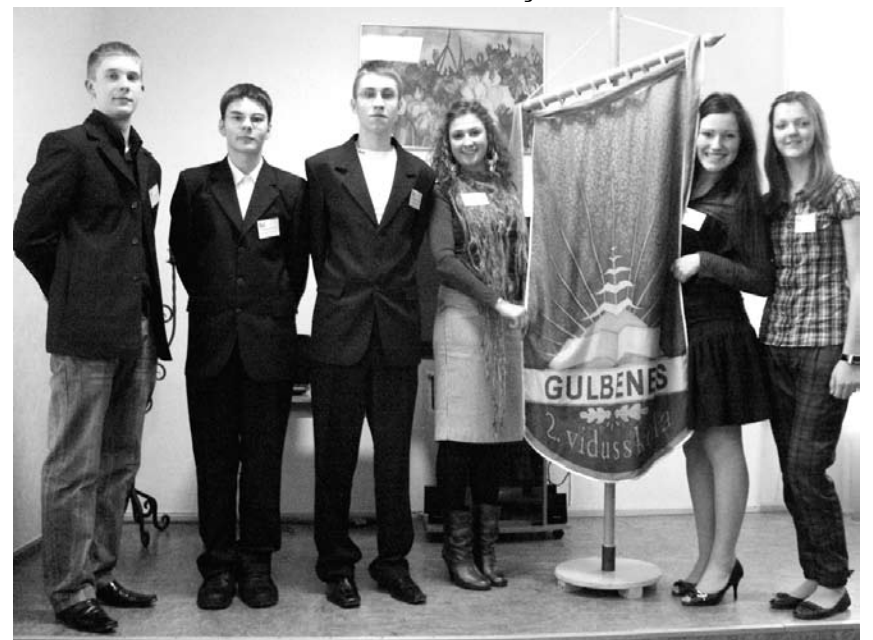
Gulbenes 2. vsk. līdzpārvaldes pārstāvji un pilsonisko projektu dalībnieki pēc tikšanās ar ārzemju delegāciju