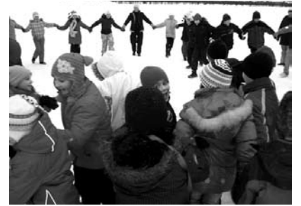
Sākumskolas skolēni Meteņdienā