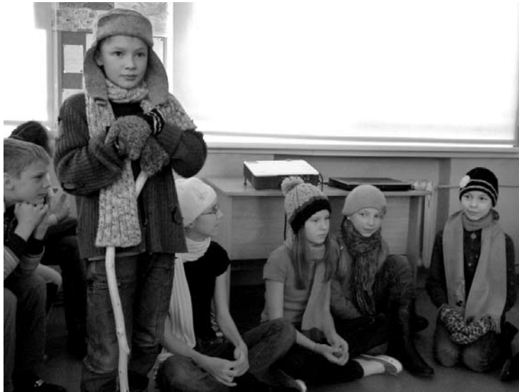
5.b klases skolēni latviešu valodas pēcpusdienā

Jaunais gads mūsu skolā sākās ar latviešu valodas nedēļu. Spēles un rotaļas notika gan mācību stundās, gan arī starpbrīžos, lai bagātinātu vārdu krājumu, sakoportu domas, uzmanīgi klausītos un justos jautri. 12. un 14. janvārī pa klašu grupām tikās 1., 2. klašu un 3., 4. klašu skolēni. Klašu grupas izložēja vienu burtu un veidoja teikumus, tā, lai katrs vārds sāktos ar šo burtu; tika minētas mīklas par zimu, kā arī