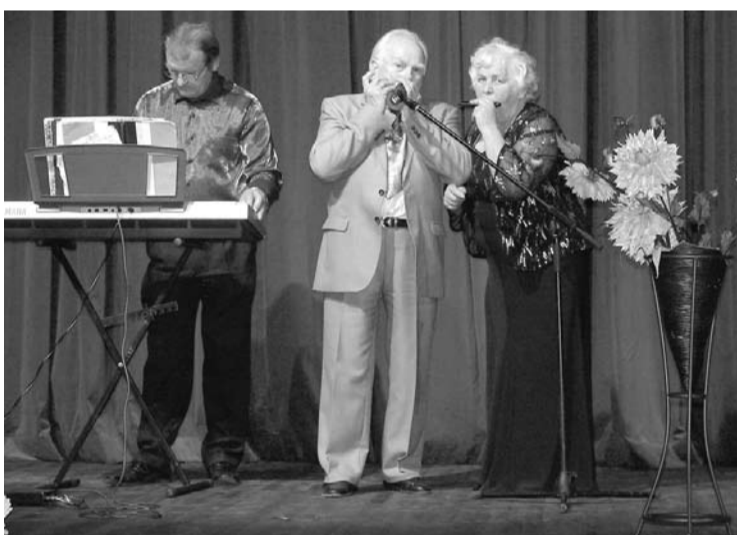
Brosovu ģimenes duets