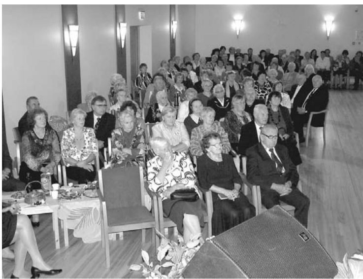
Novada seniori uz pasākumu bija ieradušies kuplā skaitā