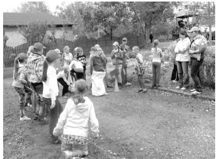
Olimpiskās dienas aktivitātes skolas pagalmā.

Bija liels prieks vērot, ar kādu nopietnību un atbildību mūsu 6.klašu skolēni veica šo viņiem