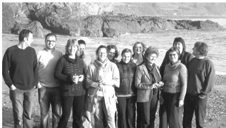
Anglijā ar sadarbības partneriem

Gulbenes novada pārstāvji šajā projektā sadarbojās ar partneriem no Anglijas, Spānijas, Ungārijas, Itālijas un Francijas. No 11. līdz 14.janvārim 2010. gadā Gulbenes delegācija, pārstāvot Latviju, devās pieredzes apmaiņas braucienā uz Angliju, kas bija projekta „Green Fingers” koordinātvalsts. Uz Ungāriju gulbenieši devās no 3. līdz 7.maijam 2010.gadā. Savukārt Spānijā novadnieki viesojās ziemassaulgriežumēnesī