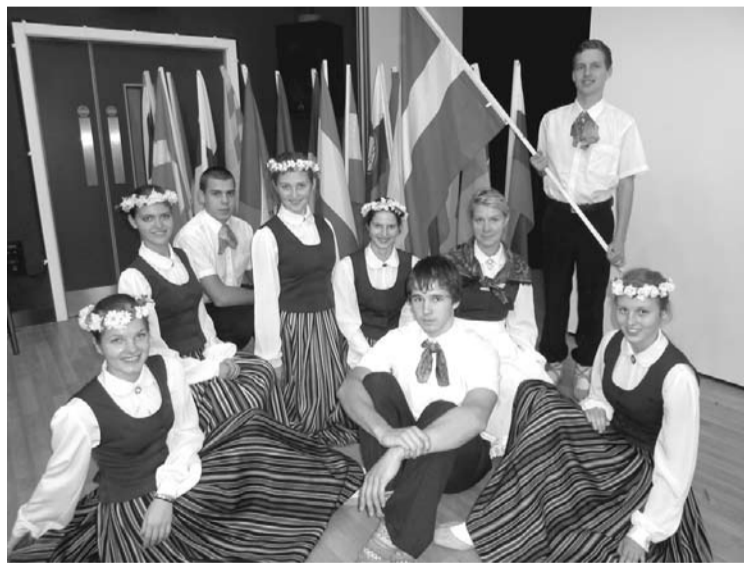
Latviešu tautas dejas sveiciens Euroweek dalībniekiem