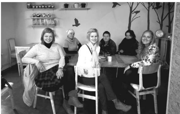
„IDEA House” tējnīcā Aizputē

Mājupceļā vēl burtiski izšāvām cauri Aizputei, kur klātienē aplūkojām biedrības „NEXT”