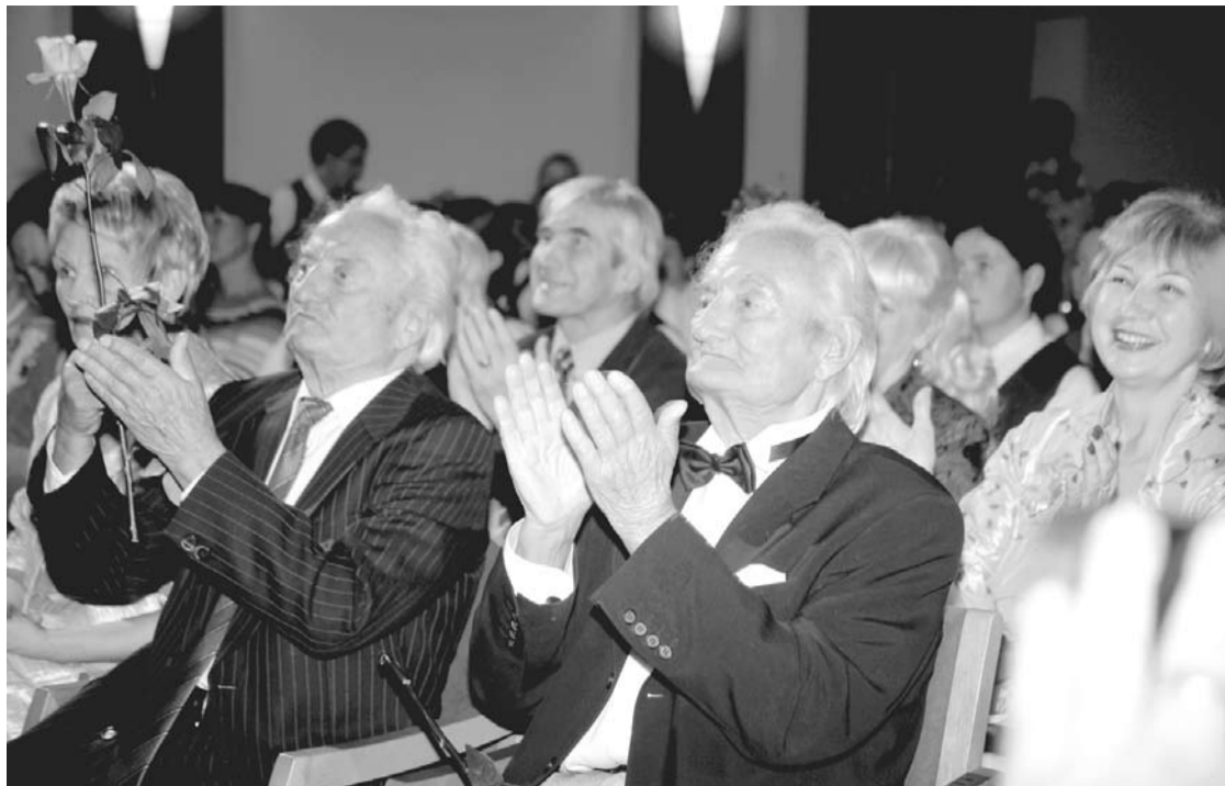
Sarīkojumā Gulbenes kultūras centrā. Priekšnesumi aizrauj visus.