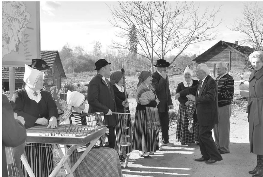
Novadnieki sagaida jubilārus pie novada robežas.

Interese par mūziku no jauna saveda abus brāļus kopā Rīgā - vienā augstskolā, vienā fakultātē, vienā nodaļā un vienā