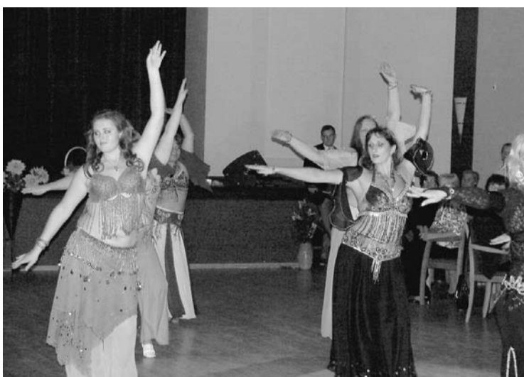
Skatītājus priecēja ugunīgi priekšnesumi