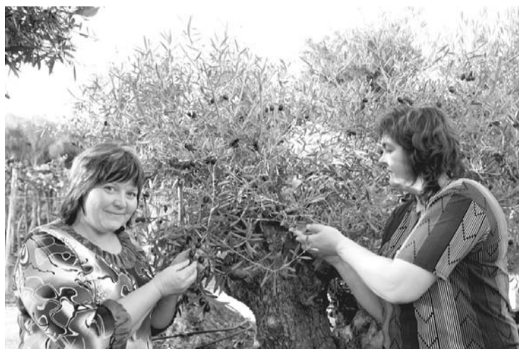
Pie spāņu olīvkoka

– no 8. līdz 12. decembrim 2010. gadā. Gulbene ārvalstu ciemiņus uzņēma jau šajā 2011.gadā no 7. līdz 11.februārim, bet uz Franciju jau vasarā, devās divi mūsu pilsētas pārstāvji laika posmā no 20. līdz 24.jūnijam.