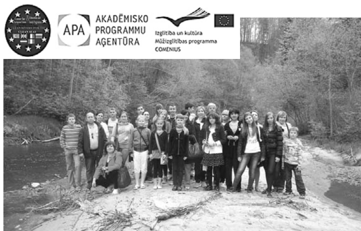
Projekta dalībnieki pēta Amatas upi un apmeklē Kārju zivjaudzētavu

Projekta gaitā ir izveidota kopīga interneta vietne, katrā valstī pētīta upju ūdens kvalitāte, izveidotas publikācijas masu medijos, noorganizēts pro-