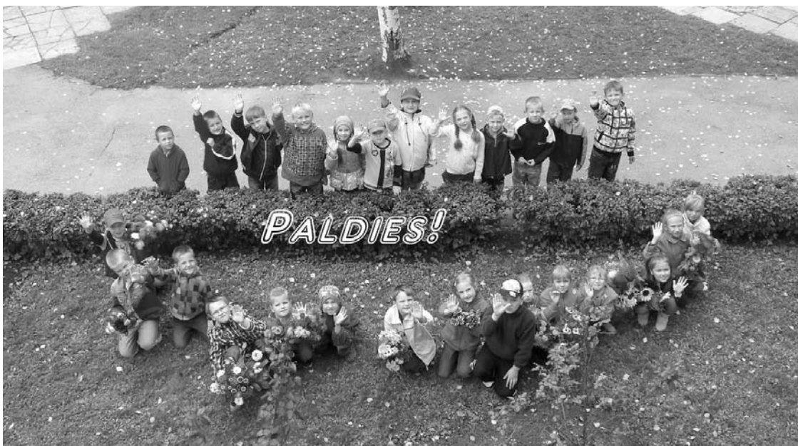
Gulbenes Bērzu sākumskolas 1.klašu skolēni saka paldies zemnieku saimniecībai “Avotiņi” un Gulbenes pilsētas pārvaldei par jaukajām dāvanām.