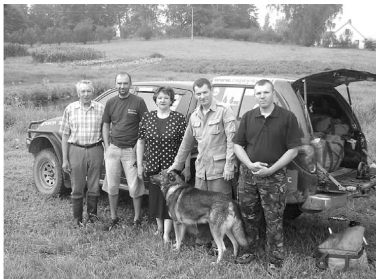
Autore kopā ar ekspedīcijas dalībniekiem "Rožkalnos"

Kā atzīmēts presē, ne visur ar meridiāna punktu meklēšanu gājis gludi. Tā kā somiem līdz pat pagājušā gada vidum Strūves meridiāna ķēde bija vienīgais mērījums, kas sasaistīja valsts dienvidus ar ziemeļiem, viņi bijuši aktīvākie projekta virzītāji. Somi no sava budžeta pat finansējuši Moldovas kolēģus, kuri bijuši visvājākais ķēdes