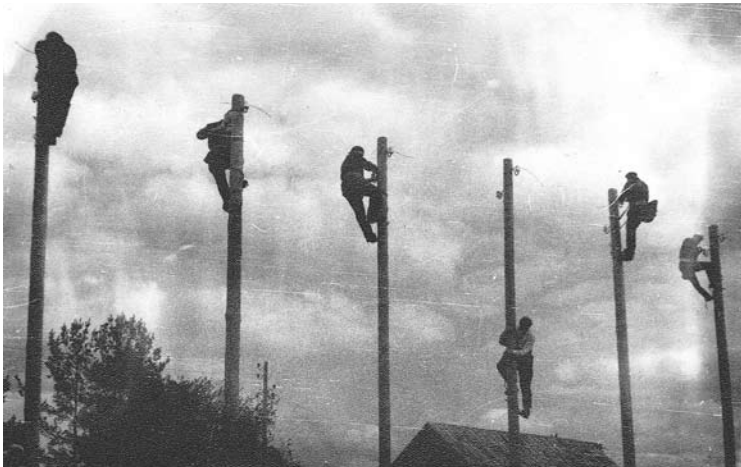
Aiviekstē, profesionālās sacensības