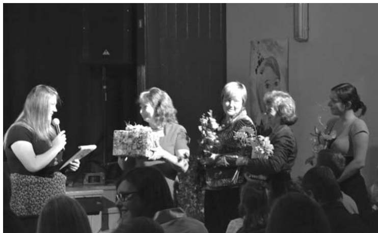
Novada domes pārstāvji sveic „Bāzi” dzimšanas dienā