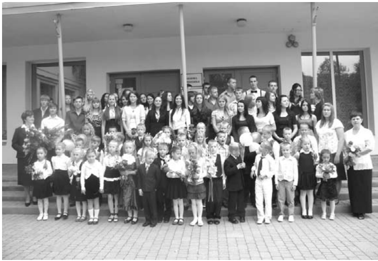
Jaunais mācību gads ir sācies

Gandarīti bija arī pirmo klašu skolēnu vecāki, jo katrs bērns saņēma interesantu grāmatiņu no Gulbenes pilsētas pārvaldes, dāvanu karti 15 latu vērtībā no uzņēmuma „Avoti”, apavu somiņu no firmas „Biznesa reklāma” un ielūgumu apmeklēt Vecgulbenes muižas kafejnīcu. Pirmo reizi negaidīts pārsteigums bija 1.klases audzinātājam no