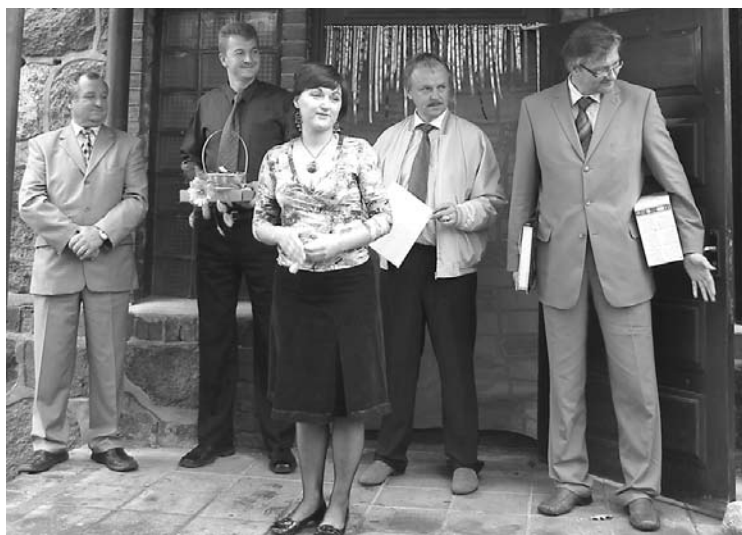
Vēsture: „Bāzes” atklāšana pirms 5 gadiem