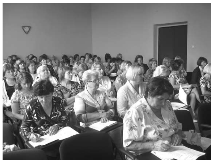
Izglītības iestāžu administrācijas pārstāvju un arodkomiteju priekšsēdētāju seminārā

2010./2011. mācību gadā novada 2984 skolēni tika iesaistīti 23 skolēnu deju kolektīvos, 18 koros,