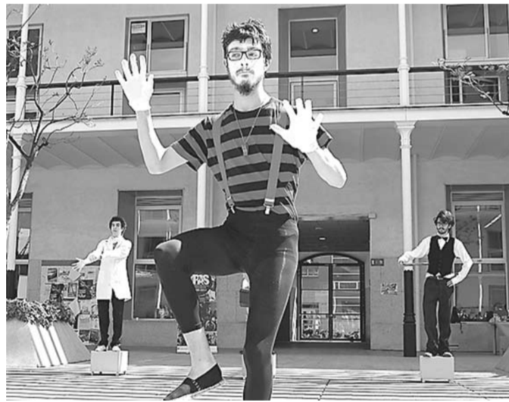
Teātra grupas Matēria Original ielu akcija.

grāmatu? Tad tagad ir īstā iespēja iesildīties! Iesaisties jaunas grāmatas tapšanas procesā un palīdzī pārrakstīt uzrakstītos tekstus.