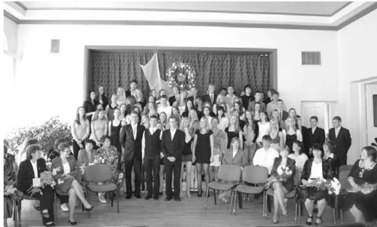
12. klašu skolēni Pēdējā zvana dienā