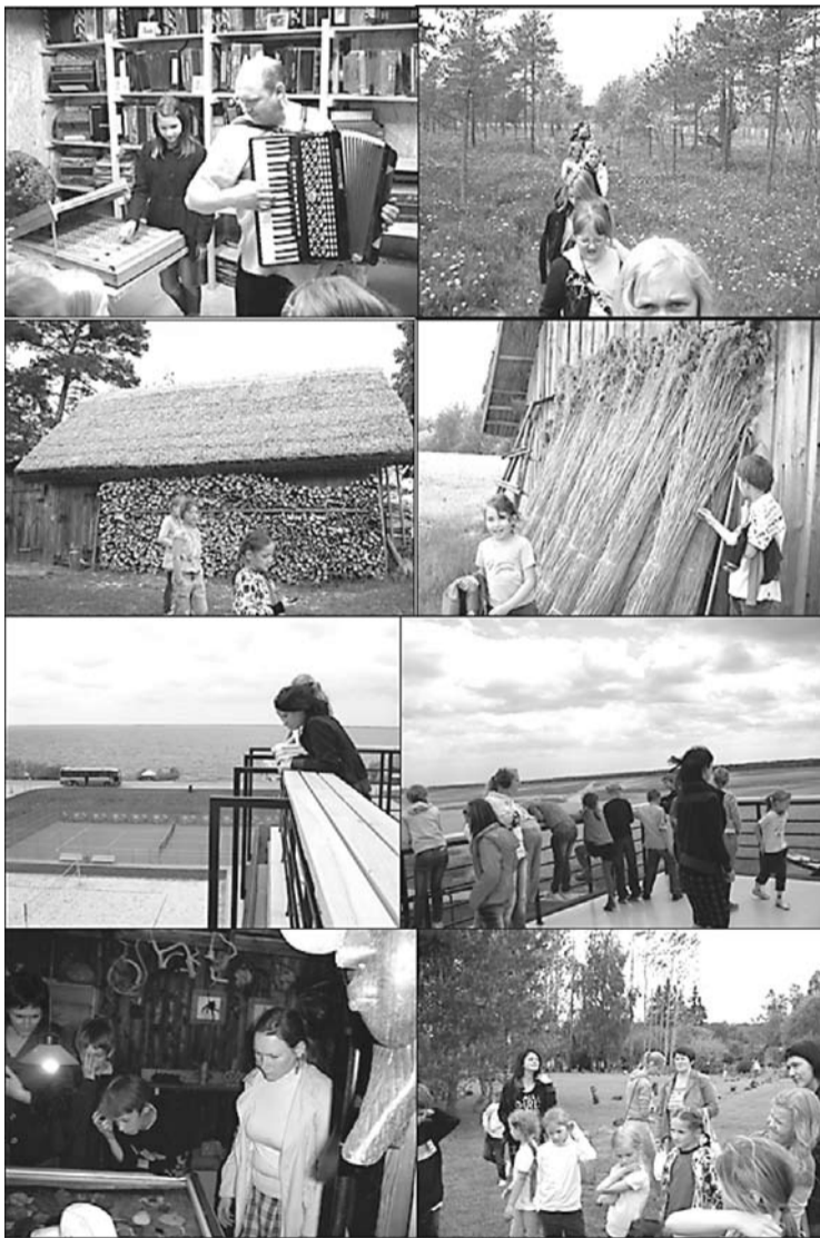
Skati no ekskursijas.