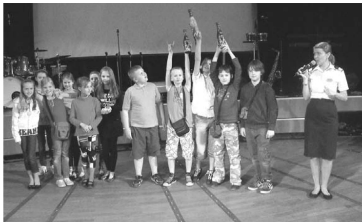
4.klases skolēni atraktīvi iesaistās aktivitātēs uz kuģa.

Mūsu vienpadsmitie izdejojās diskotēkā, kā arī iepazinās ar jauniem draugiem. Dejošana ir īpaša, jo kuģi kaut nedaudz, tomēr šūpoja jūras viļņi.