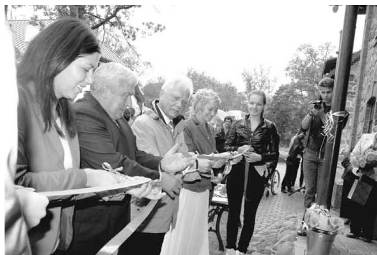
Svinīgajā lentas pārgriešanā piedalās gan projekta finansētāji, gan pašvaldības pārstāvji.

7.septembrī Gulbenes novada jauniešu centrs „Bāzē” atzīmēja savas pastāvēšanas 6.gadadienu. Pasākuma ietvaros centra darbinieces prezentēja Latvijas un Šveices sadarbības programmas apakšprojektā „Jauniešu iniciatīva ilgtspējīgai attīstībai” realizēto „Bāzē” tagad ir kļuvusi par multifunkcionālu centru, kura izremontētajās telpās jauniešiem ir pieejamas modernas informācijas tehnoloģijas, mūzikas instrumenti, inventārs brīvā laika pavadīšanai un citas iespējas.