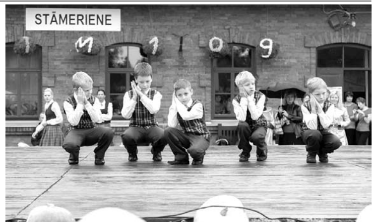
Svētkos priecēja mazie dejotāji