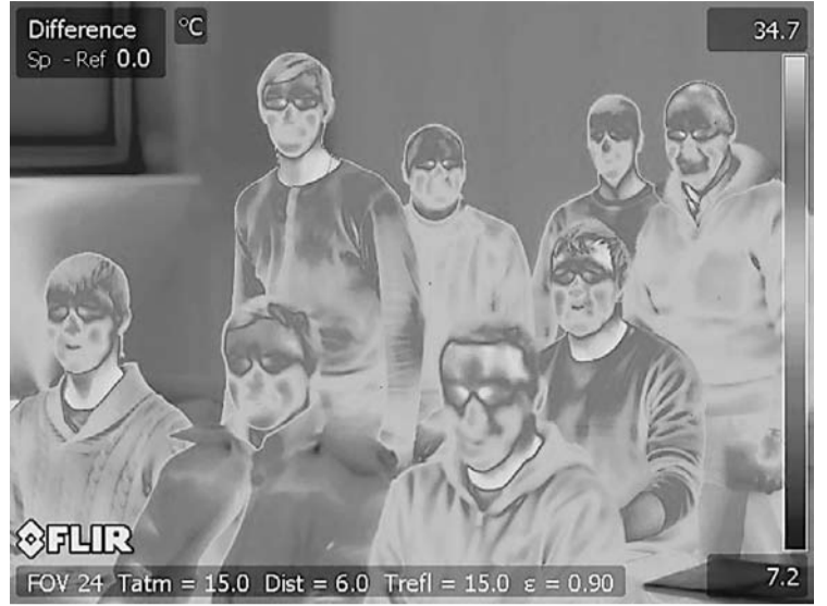
Apmācību kursa dalībnieki (Fotografēts ar termogrāfu praktisko apmācību laikā)

Kā atzīst pašī apmācību dalībnieki, mācību laikā tika paaugstinātas zināšanas par celtniecību, ēku siltumtehniku, ēku inženiersistēmām, kā arī apgūtas energoapreķina metodes un iegūtas citas vērtīgas zināšanas. Apgūtais palīdzēs realizēt pašvaldības