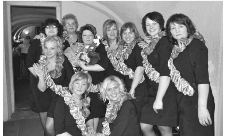
Sieviešu vokālais ansamblis „Pieskāriens”

Februāra izskaņā Lizuma kultūras namā notika Gulbenes novada vokālo ansambļu skate, kurā piedalījās 21 kolektīvs.