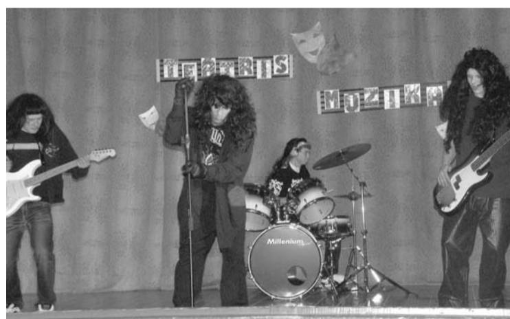
Konkursa Teātrus mūzikā uzvarētāji – grupa The Hobos

Konkursā tika piešķirtas divas pirmās vietas - popūrijam „Jampadracis” no Raudas speciālās internātpamatskolas un grupai „Korn” no Sveķu skolas. Grupa „Korn” ieguva arī skatītāju simpātiju balvu. Sveķu skolas