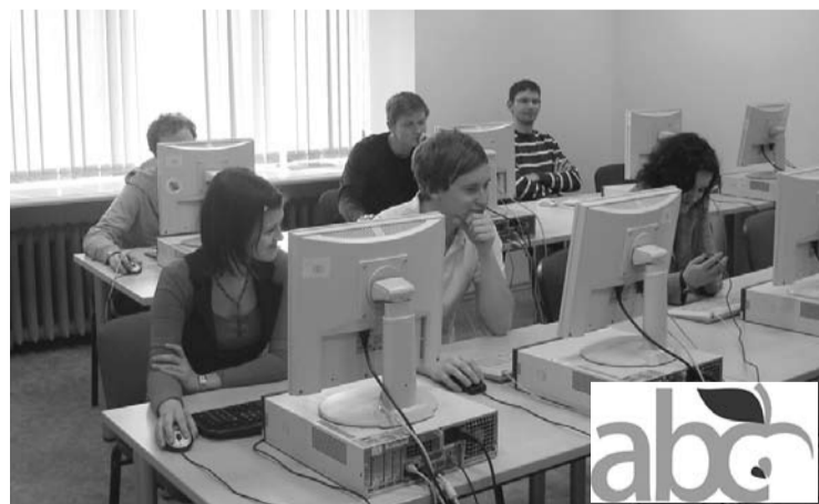
Tiek apgūtas datorprasmes Adobe Photoshop un Adobe Illustration

Mācību centrs piedāvā apgūt dažādas izglītības programmas mūsu e-nodaļā. Ko tas nozīmē? Jums ir iespēja iegūt papildu kvalifikāciju, jaunas zināšanas izvēlētajā mācību programmā interneta tiešsaistē, pat neizejot no mājas. Šis piedāvājums