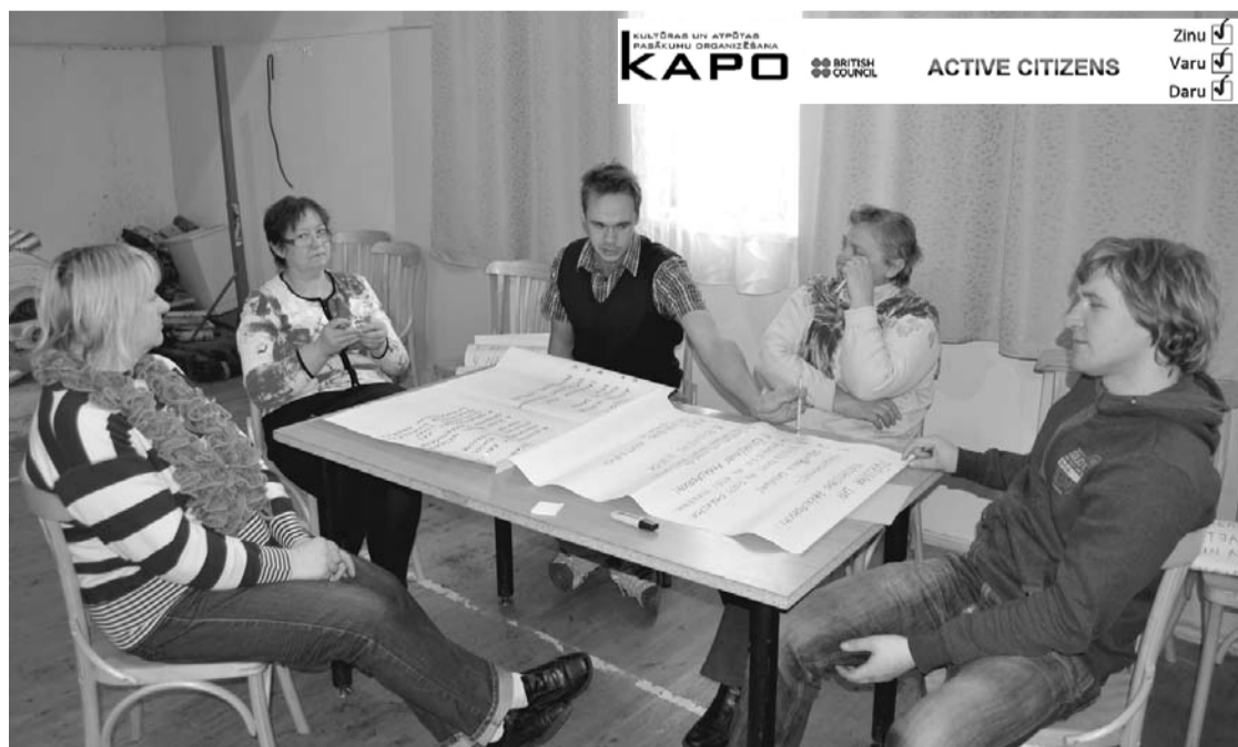
Pie viena galda - dažādu paudžu iedzīvotāji

Kaut arī iepriekš neparedzama, bet būtiska iemesla dēļ, foruma dalībnieku nebija daudz. Atnākušie dažāda vecuma kalnieši bija ieinteresēti savas kopienas attīstībā un kopīgās sarunās darba grupās cītīgi strādāja trīsarpus stundas. Forumā galvenās tēmas bija: jaunieši, kultūra un brīvais laiks, apkārtnē vide un pakalpojumi (t.i. infrastruktūra) un uzņēmējdarbības vide. Katra grupa izvērtēja esošās labās lietas un problēmas katra tēmā un izvirzīja idejas, kā problēmas risināt. Pēc tam grupas izstrādāja jau konkrētās idejas mērķus, uzdevumus, aktivitātes un nepieciešamos resursus.