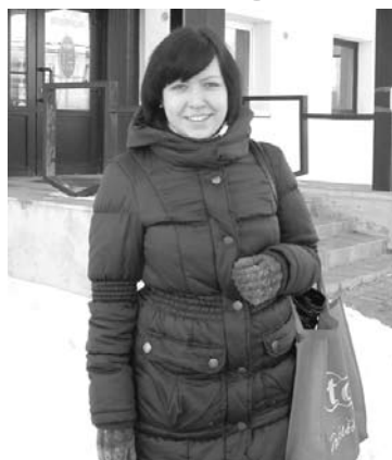
Niņa: „Lai mēs labi dzīvotu! Lai visiem būtu normāla pensija. Un, protams, vēlu visiem veselību!”

Gulbenietis: „Lai Gulbene attīstās tāpat, kā pēdējos trīs gadus. Tā arī turpināt, lai viss iet uz priekšu!”