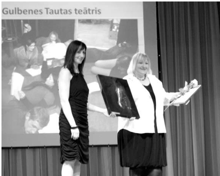
Gada amatiermākslas kolektīvs - Gulbenes Tautas teātris