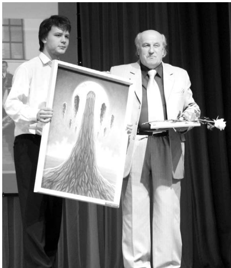
Nominācija „Gada mūzikas koncerts” - Gulbenes Mūzikas skolas pūtēju orķestrim