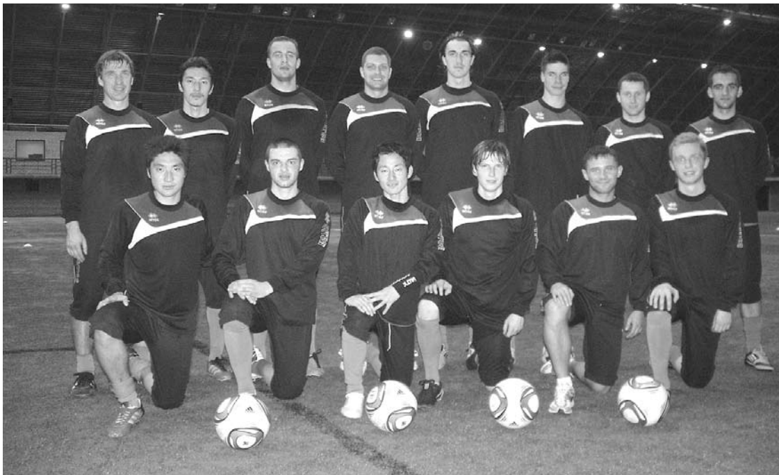
FB Gulbene komanda

Šķiet, nesēn sagaidīts Jaunais gads, bet jau klāt februāra vidus, un pēc mēneša sāksies kārtējā futbola sezona. Tāpat kā pērn, Gulbenes komandai atkal viss jāsāk no jauna. Galvenā problēma – finanses. Neskatoties uz to, ka nu jau trešo gadu mūsu futbolisti cienīgi nes Gulbenes vārdu ne tikai mūsu valstī, bet arī pasaulē, jūtamas palīdzības gan no vietējiem uzņēmējiem, gan, saprotamu iemeslu dēļ, no novada domes pagaidām neesam sagaidījuši.