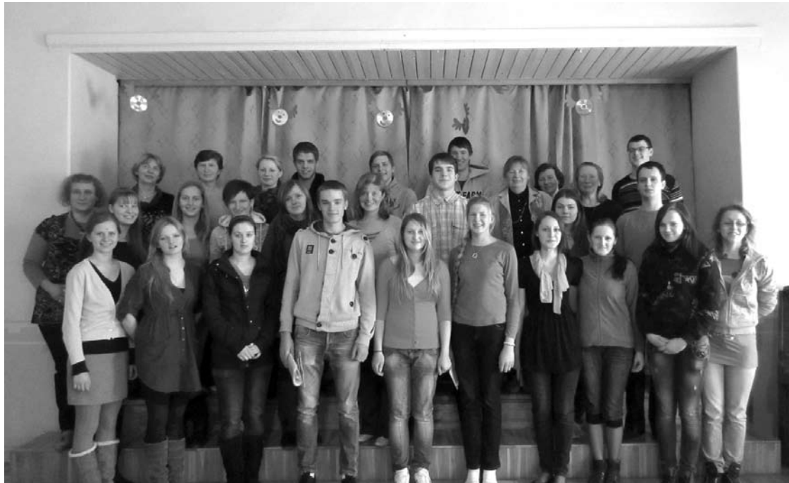
Debatētāji un klausītāji pēc pasākuma.

Šajā mācību gadā Lizuma vidusskola ir iesaistījusies projektā „Par tainīgumu sabiedrībā: izglītības rosinātas pārmaiņas”, kuru uzsākusi biedrība GLEN Latvija un programma „Iespējamā Misija”. Viens no projekta mērķiem ir aktualizēt diskusiju par tainīgumu un vienlīdzīgām iespējām vietējā un globālā mērogā.