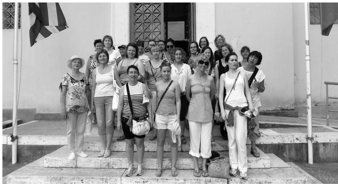
Projekta dalībnieki Grieķijas pilsētā Hanthi

Latvijas skolās arvien nozīmīgāka kļūst katra skolēna īpašo vajadzību respektēšana un individuālās pieejas īstenošana, kas atbilst mūsdienīgai izpratnei par mācību procesu.