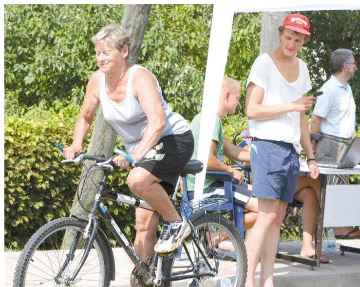
Katru gadu uz velosipēda 10 kilometru distancē sacensībās „Šķūnenieku kauss”

tīvi, bet pēdējos astoņpadsmit gadus viņa ir pensionāru ansambļa „Satekas” dalībniece. „Mūsu vecumā nedrīkst sēdēt mājās! Kurp aicina, tur jābrauc. Ar ansambli esam izbraukājuši visu Latviju – gan koncertējot pie draugiem, gan dodoties ekskursijās. Ansamblis man ir vieta, kur tu aizej padziedāt, izrunāties, uzlabot garastāvokli, un tad var dzīvot tālāk! Nesaprotu pensionārus, kas sēž mājās un raud – šis taču ir mūsu pēdējais laiks. Kad tad vēl? Ir jādzīvo!” ar op-