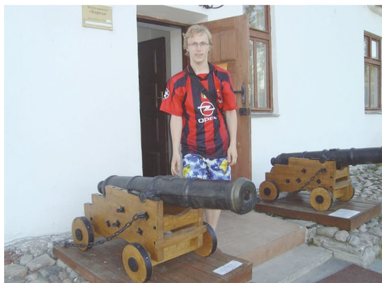
Apceļojot kaimiņzemes. Krievijā

„Katra diena ir jauns piedzīvojums, tādēļ baudīsim