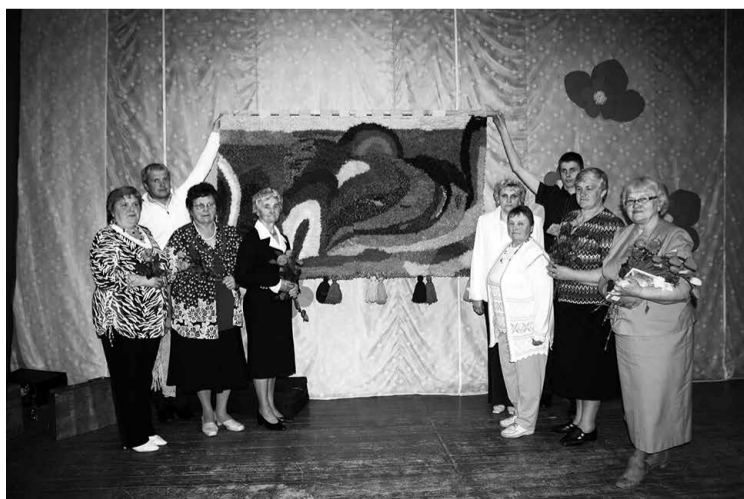
Beļavas pagasta rokdarbu pulciņš „Dzīpariņš”