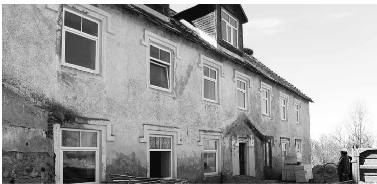
Bijusī Siltāju pamatskolas ēka

Soli pa solim bijušajā Siltāju pamatskolas ēkā atgriežas dzīvība – te uzsāka sociālā centra izveide. Plānots, ka gada beigās varēs uzņemt pirmos iemītniekus. „Šī ir projekta 1.kārta, kuras ietvaros sakārtosim 1. un 2.stāva telpas dzīvošanai. Tā kā šis ir