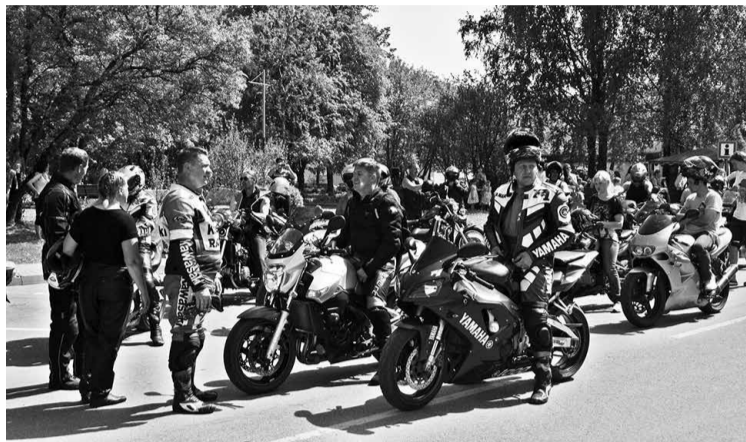
Gulbenes ielas atdzīvināja motociklisti