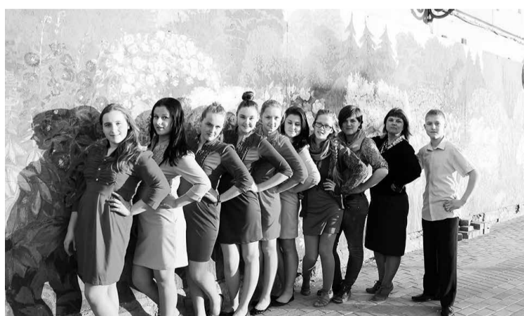
Izrādes dalībnieki ne tikai runāja Ziedoņa tekstus, bet arī dziedāja un spēlēja kokli un ģitāru