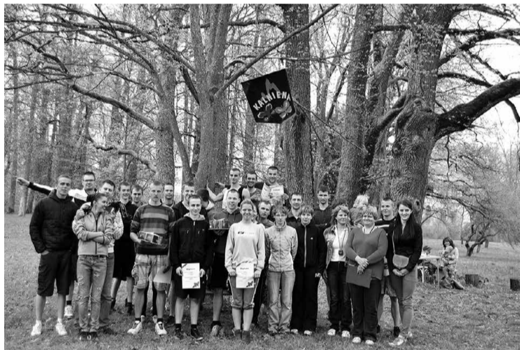
Sporta spēju dalībnieki ar godam nopelnītu uzvaru

11.maijā Kalniena notika tradicionālās Neparastās sporta spēles. Šogad tajās piedalījās 7 komandas (ar 4 dalībniekiem katrā). Kalnienā tika gaidīts ikviens, kuram patīk pavadīt laiku brīva dabā, pildot neparastus komandas uzdevumus, kas liek gan pārbaudīt savas spējas un veiklību, gan uzticēšanos komandai.