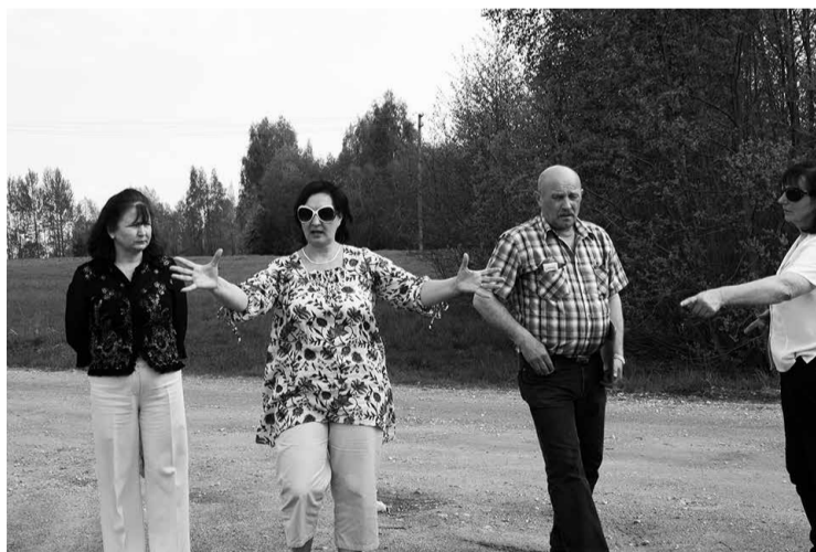
Svētku organizatori Tirzā

Jau vairākus mēnešus norit gatavošanās trešajiem Gulbenes novada svētkiem, kas šogad notiks 3.augustā Tirzā. Lai precizētu visu svētkiem nepiecieša-