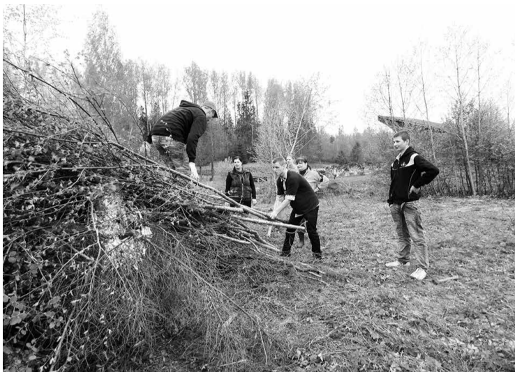
„Mākoņu stūmēji” sakopšanas talkā

„Mākoņu stūmēji”, kas ir jauniešu iniciatīvas grupa Tirzā, aicināja uz estrādes sakopšanas talku 11. maijā. Pasākums pulcēja vairāk nekā 30 dalībniekus. Jaunākajam dalībniekam bija 4 mēneši, bet vecākajam - 50 gadi.