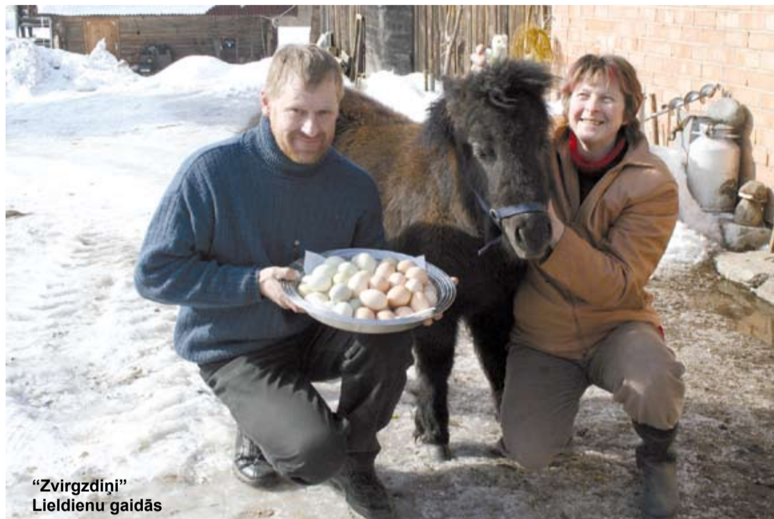
„Zvirgzdiņi” Lieldienu gaidās

Marta saulē gaviļē zaigojoša lāsteka. Paslēpusies zem šķūņa jumta, tā gaida pavasari. Rotaļīgā ponijmeitene Nāra lepriņi soļo pa saimnieku rūpīgi iztīrīto pagalmu, šķelmīgi meklējot savu draugu – prāvu sargsuni. Zemiņu saimniecības „Zvirgzdiņi” sētā, kas atrodas gleznainajā Druvienas pusē, darbi rit ierastā