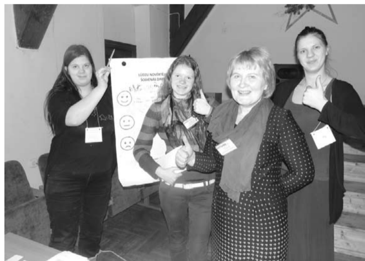
Iedzīvotāju forums Tirzā ir izdevies

2.februāra rītā Tirzas pagasta Biedrības namā uz 2.Tirzas pagasta iedzīvotāju forumu pulcējās 69 pagasta iedzīvotāji: jaunieši un seniori, uzņēmēji un pašvaldības deputāti, pagasta iestāžu darbinieki un nevalstisko organizāciju biedri. Ikvienu sagaidīja pagasta skaistāko ainavu foto uzņēmumi un jauniešu sveiciens. Gandrīz divas stundas interešu grupās tika diskutēts par kopienai svarīgiem jautājumiem. Visu diskusijas laiku bija jūtama atbildība par to, ko mēs paši varam: cilvēki diskutēja un ieklausījās, darba grupu priekšlikumus uzņēma ar aplausiem. Šoreiz tika meklētas vajadzības, kuru risināšana varētu būt pašu iedzīvotāju rokās. Esam izauklējuši idejas par jauniešu centru, pagasta laikraksta „Tirzaskrasts” atjaunošanu, interešu klubu senioriem, estrādes sakopšanu, apgaismojuma un gājēju ceļu ierīkošanu. Uzņēmēji gatavi dalīties ar padomiem un idejām, seniori - doties pie skolas un pirmsskolas bērniem, lai kopā darītu vienkāršas, bet katram svarīgas lietas. Forums bija beidzies, bet cilvēki vēl kavējās zālē, sarunājās; sejas bija gaišas un acis priecīgas.