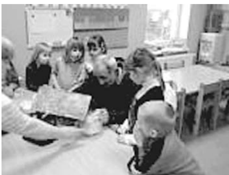
Kopā ar Ksenijas vectēvu

Uz palodzes asnus dzen sīpolsuņi. Aiz loga izliktas putnu barotavas mazajiem putniņiem. Drīz bērni dosies ciemos pie 1.-