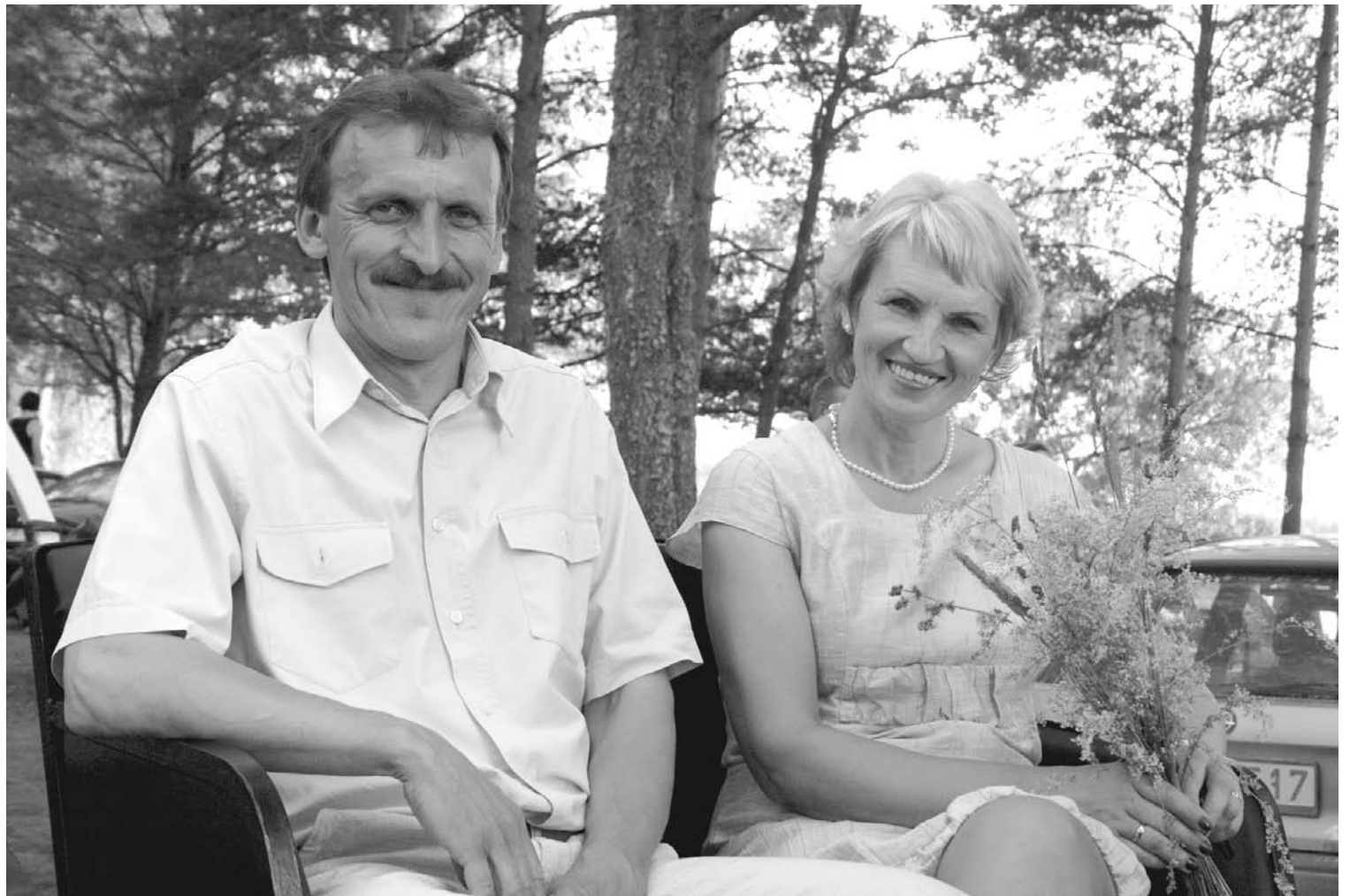
2012.gada 7.jūlijā Stāmerienas pagastā tika svinēti otrie novada svētki „Stāmerienas gredzens”