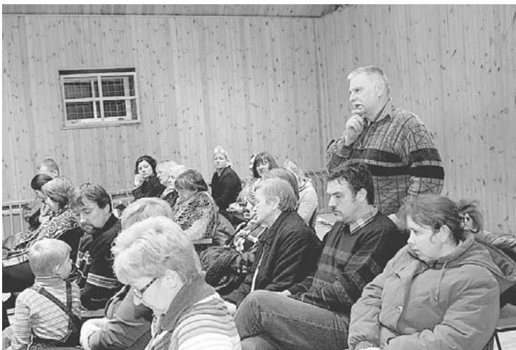
Tikšanās ar Beļavas pagasta iedzīvotājiem 2012.gada 12.janvārī