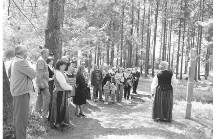
2012.gada 19. maijā tūrisma sezonas atklāšanas pasākuma ietvaros Gulbenes Spārītes parkā tika atklāts jauns tūrisma objekts – Latviju zīmju vēstījumu taka