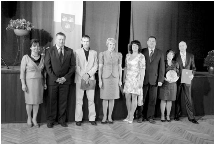
2012.gada vasarā novada dome organizē konkursu „Attīstība, vide, sakoptība Gulbenes novadā 2012”, bet 19.oktobrī Līgo pagasta kultūras namā norisinājās konkursa noslēguma pasākums