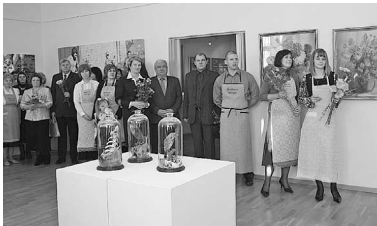
2012.gada 31.janvāris - Gulbenes novada vēstures un mākslas muzejam atzīmē 30 gadu jubileju