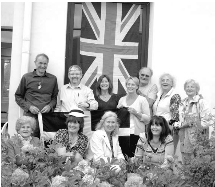
Gulbenē ierodas seši brīvprātīgie seniori no Anglijas. Projekta „Nature Nurture” ietvaros darbojās kopā ar Gulbenes novada senioriem. Šāds projekts tika realizēts tikai divos Latvijas novados – viens no tiem bija Gulbenes novads