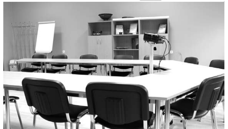
26.janvārī iedzīvotāji aicināti uz telpu atklāšanas pasākumu.

Druvienas pagasta attīstības biedrība „Pērļu zvejnieki” ir realizējusi projektu “Materiāli tehniskā aprīkojuma pilnveide un telpas labiekārtošana sabiedrisko aktivitāšu dažādošanai Druvienas pagasta iedzīvotājiem”, projekta Nr. 12-07-LL05-L413202-000001. Papildināts biedrības materiāli tehniskais aprīkojums ar mūsdienīgu tehnoloģiju aprīkojumu un ir pielāgota telpa apmācību, semināru un lekciju organizēšanai, kā arī interešu grupu nodarbību norisēm.