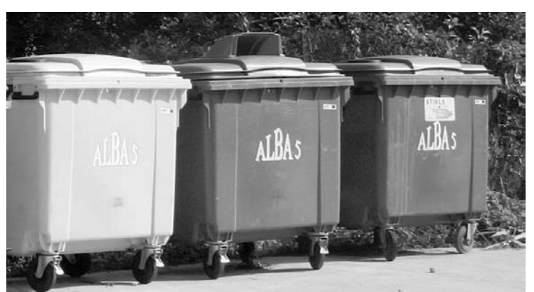
Ar Lauku atbalsta dienesta finansējumu novada dome realizē projektu par dalīto atkritumu konteineru uzstādīšanu pagastos, lai arī lauku iedzīvotāji tos varētu šķirot