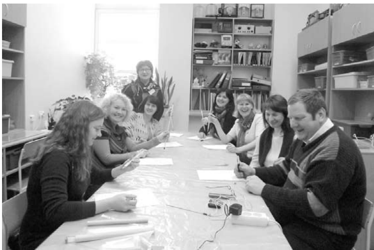
Eksperimentē pašatīstākie un ieinteresētākie vecāki

Galvenie decembra notikumi, protams, ir Ziemassvētku pasākumi. Gaidot svētkus, piedalījāmies labdarības akcijā „Dālies priekā!”. Paldies visiem vecākiem, bērniem un skolotājiem, kuri atsaucās un dalījās! 1.-6. klases svētku uzvedumam- muzikālajai izrādei „Brīnumsvecīte” rosīgi gatavojās skolas interešu izglītības