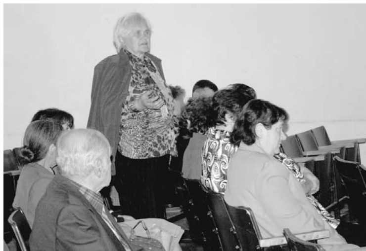
Tikšanās ar Daukstu pagasta iedzīvotājiem 2012.gada 7.jūnijā. 2011.gada decembrī novada dome iesāka jaunu tradīciju – domes vadības un nodaļu vadītāju tikšanās ar iedzīvotājiem pagastos