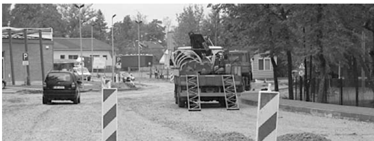
2012.gadā tika rekonstruēta Parka iela Gulbenē

ir ūdenssaimniecības projekti lielākajā daļā pagastu, sociālās aprūpes centra izveide Siltajos, Lizuma vidusskolas fasādes remonts un citi projekti.