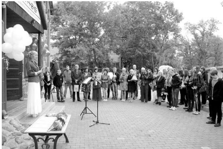
2012.gada 7.septembris - Gulbenes novada jauniešu centra „Bāze” kā multifunkcionāla centra atklāšanas pasākums