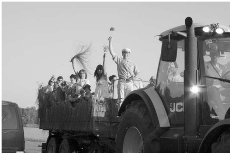
Novada svētki „Stāmerienas gredzens” – svētku gājiens, kurš apmeklētājos raisīja sajūsmu un apbrīnu par pagastu sarūpētajām transporttehnikas vienībām