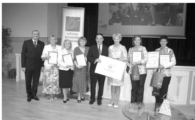
2012.gada 14.septembrī Gulbenes novada delegācija Ventspilī piedalās konkursa „Eiropas Gada pašvaldība 2012” noslēguma pasākumā, kur saņem galveno balvu – Eiropas gada pašvaldības 2012 titulu