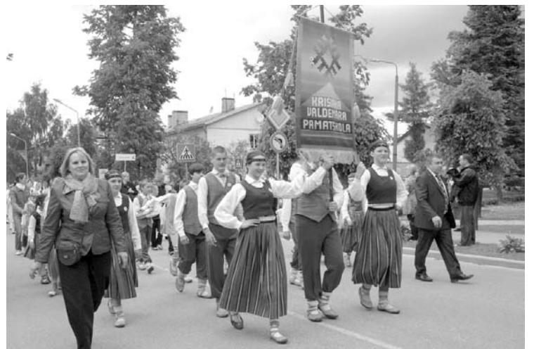
Latvijas skolu jaunatnes deju festivāls „Latvju bērni danci veda” - „Burvju stabulīte” Gulbenē 2012.gada 2.jūnijā. Pasākumā piedalās vairāk 3000 bērnu