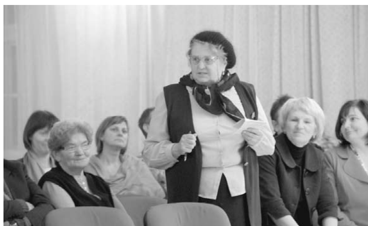
Tikšanās ar Litenes pagasta iedzīvotājiem 2012.gada 12.decembrī