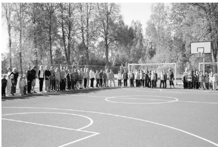
2012.gada 21.septembrī Stāmerienā tika atklāts rekonstruētais Stāmerienas pamatskolas sporta laukums