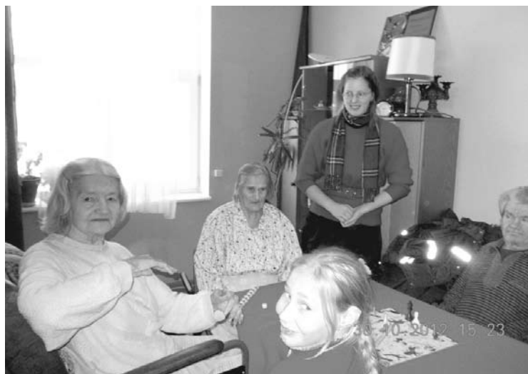
Ciemos Tirzas sociālās un veselības aprūpes namā

vērts īstenot šo projektu, jo tā bija iespēja gan vecāko klašu skolēniem, gan mazākiem bērniem iesaistīties jaunās aktivitātēs. Mēs iepriecinājām cilvēkus veco ļaužu namā un turpināsim iet pie viņiem ciemos. Galda spēles arī turpmāk