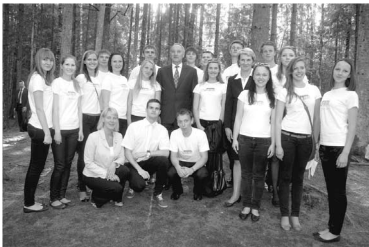
2012.gada 14.jūnijas - Komunistiskā genocīda upuru piemiņas dienas pasākumi Gulbenes novadā. Viesojas Valsts prezidents Andris Bērziņš. Fotoattēlā redzams kopā ar Gulbenes novada valsts ģimnāzijas kori „Silver”