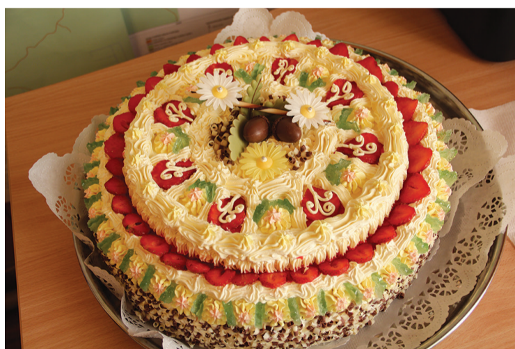
Torte valsts prezidentam A.Bērziņam. Autors Astrīda Dzērve (Litenes pagasts)

Konkurss ir lieliska iespēja toršu cepējiem pārliecināties par savām spējām, rast jaunus iespaidus, profesionālos knifņus. Savukārt skatītājiem, šis konkurss ļaus iepazīt izcilus meistarus un viņu meistardarbus. Šajā konkursā aicināts piedalīties ikviens gardumu gatavotājs. Varbūt kādam ir īpaša recepte, vai toršu cepšana ir tikai hobijs, bet varbūt kādam toršu gatavošana ir sava veida izteikšanās iespēja, bet varbūt vēl kādam toršu cepšana ir ienākumu avots. Aicinām konkursā piedalīties, gan iesācējus, gan tādus meistarus, kuri tortes cep visu mūžu. Nešaubāties, ka