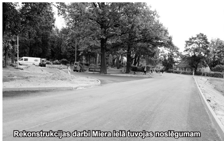
Rekonstrukcijas darbi Miera ielā tuvojas noslēgumam