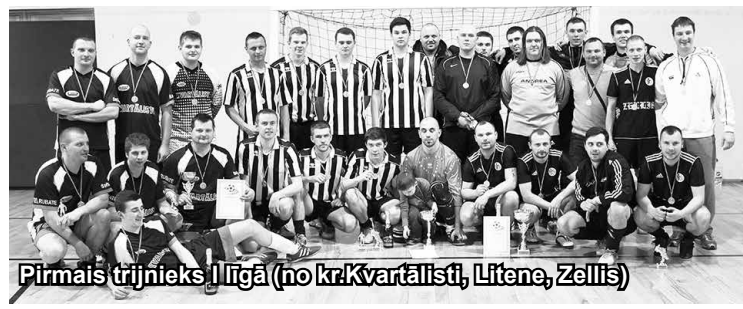
Pirmais trijnieks I līgā (no kr. Kvartālisti, Lītene, Zellis)