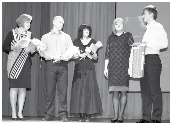
Veiksmīgākā izstāde muzejā - izstāde par ugunsdzēsējiem „Viens par visiem, visi par vienu” Gulbenes novada vēstures un mākslas muzejā