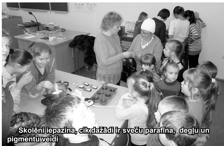
Skolēni iepazīna, cik dažādi ir sveču parafīna, degļu un pigmentu veidi

Vairāk nekā 30 skolēni no 1., 5., 6. un 7.klases iemācījās lietot sveces. Skolēni iepazīna sveču parafīna veidus, degļu daudzveidību, pigmentu lietošanas prasmes. Sveču liešana prasa pacietību un spēju nogaidīt, kamēr katras krāsas kārtā atdziest, lai varētu veidot krāsu ornamentus. Bez tam skolēni mācījās lietot ziepes, kas pašiem radīja prieku pagatavot sev ziepju gabaliņus. Interessants un aizraujošs ir brīdis, kad skolēni ierauga gatavu sveci kā ģeometrisku, puķes vai dzīvnieka formu. Darbnīcu dalībnieki iemācījās prasmes,