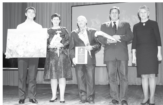
Gada novada kultūras pasākums - jauniešu deju nometne Tīrzā „Viņi dejoja vienu vasaru”