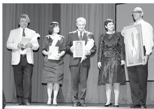
Gada mūzikas koncerti/ konkursi/ projekti - brīvdabas uzvedums „Limuzīns Jāņunakts krāsā” Jaungulbenē