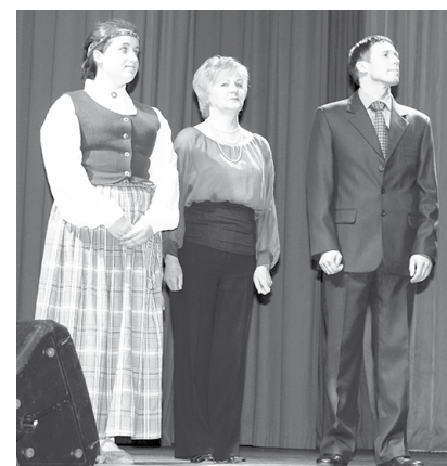
Gada amatiermākslas kolektīvs - folkloras kopa „Pērlis”