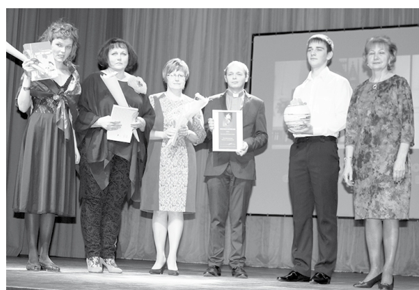
Par gada vizuālās mākslas projektu tika atzīta Altāra Enģeļa atjaunošana Gulbenes ev. Luteriskajā baznīcā