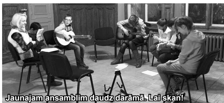
Jaunajam ansamblim daudz darāmā. Lai skan!