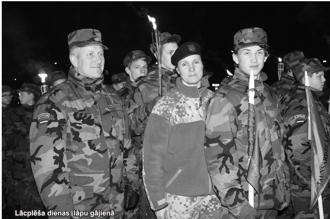
Lāčplēša dienas lāpu gājienā

Pavadot divas dienas āra apstākļos un veicot dažādos uzdevumus, jaunieši sadraudzējās, saliedējās un nevērtē otru jaunieti pēc tā, kādas firmas apģērbs mugurā, bet pēc izpalīdzīguma, atsaucības, draudzīguma,