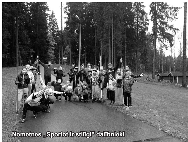
Nometnes „Sportot ir stilīgi” dalībnieki