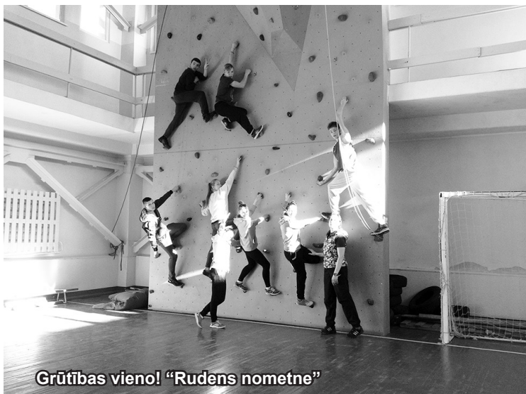
Grūtības vieno! „Rudens nometne”