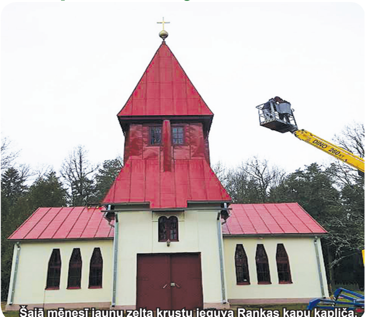
Šajā mēnesī jaunu zelta krustu ieguva Rankas kapu kapliča.