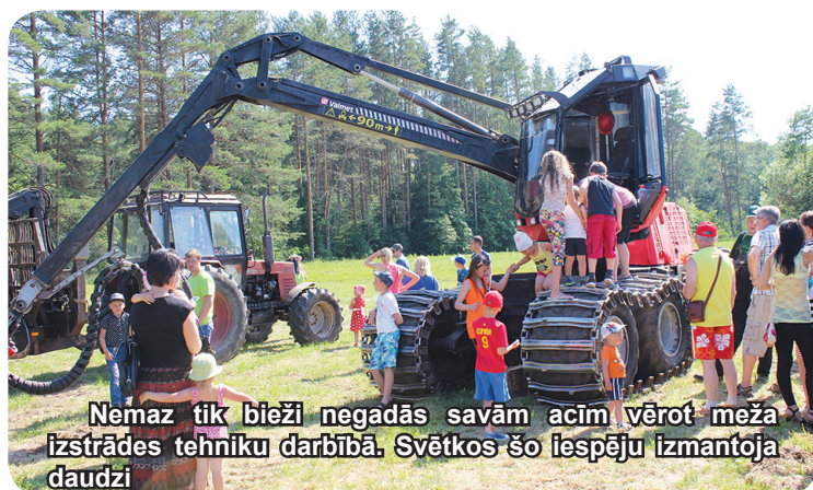
Nemaz tik bieži negadās savām acīm vērot meža izstrādes tehniku darbībā. Svētkos šo iespēju izmantoja daudzi