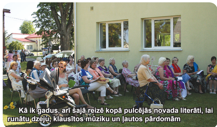
Kā ik gadus, arī šajā reizē kopā pulcējās novada literāti, lai runātu dzējū, klausītos mūziku un ļautos pārdomām