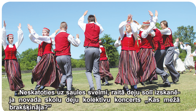
Neskatoties uz saules svelmi, raitā deju solī izskanēja novada skolu deju kolektīvu koncerts „Kas mežā brakšķināja?”