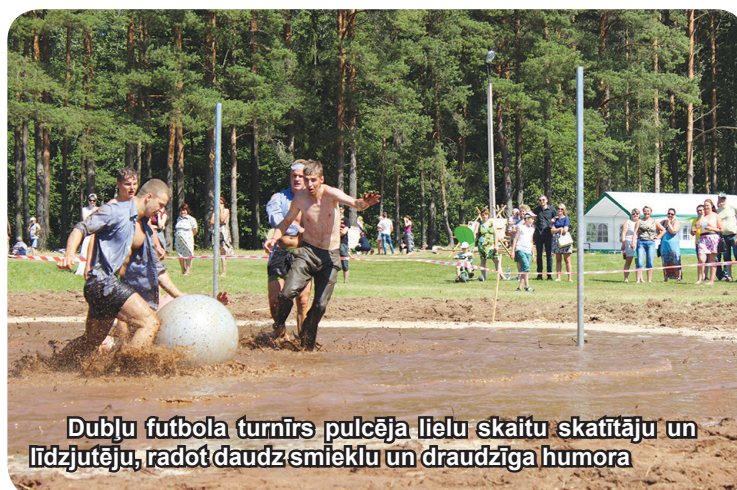
Dubļu futbola turnīrs pulcēja lielu skaitu skatītāju un līdzjutēju, radot daudz smieklīgu un draudzīga humora