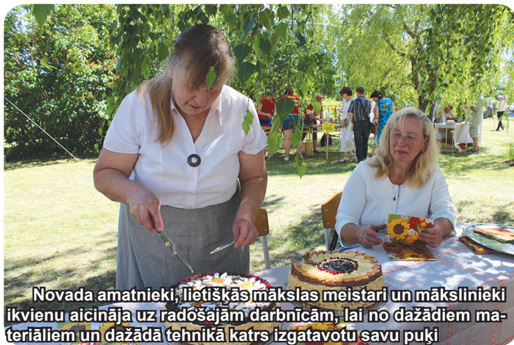
Novada amatnieki, lietiskās mākslas meistari un mākslinieki ikvienu aicināja uz radošajām darbnīcām, lai no dažādiem materiāliem un dažādā tehnikā katrs izgatavotu savu puķi