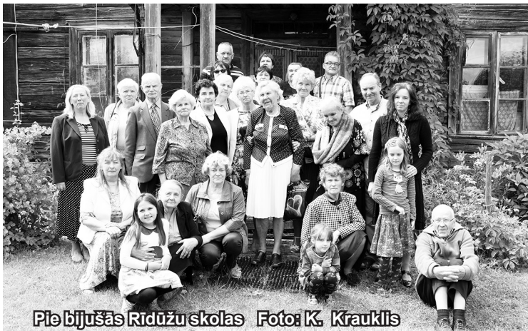
Pie bijušās Rīdūžu skolas