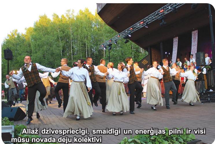
Allaž dzīvespriecīgi, smaidīgi un enerģijas pilni ir visi mūsu novada deju kolektīvi