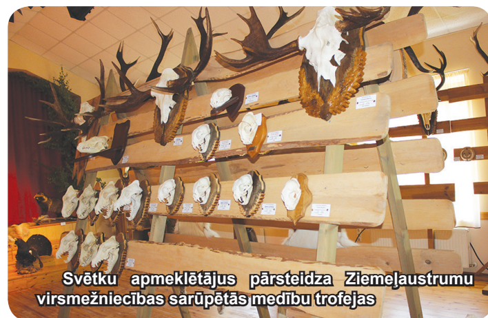
Svētku apmeklētājus pārsteidza Ziemeļaustrumu virsmežniecības sarūpētās medību trofejas