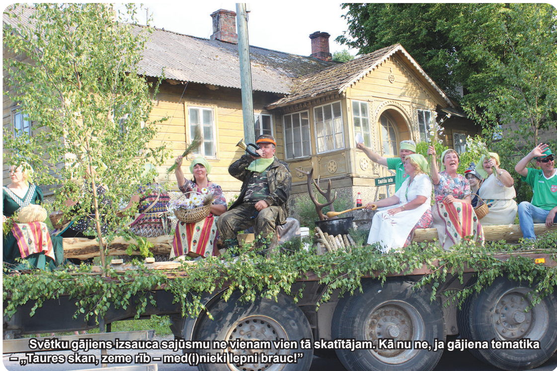
Svētku gājiens izsauca sajūsmu ne vienam vien tā skatītājam. Kā nu ne, ja gājiena tematika – „Tāures skan, zeme rīb – med(i)nieki lepni brauc!”