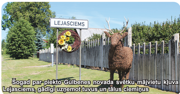
Šogad par piekto Gulbenes novada svētku mājvietu kļuva Lejasciems, gādīgi uzņemot tuvus un tālus ciemiņus