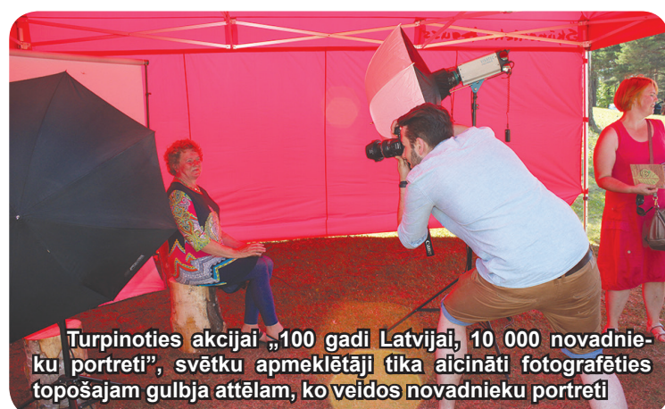
Turpinoties akcijai „100 gadi Latvijai, 10 000 novadnieku portreti”, svētku apmeklētāji tika aicināti fotografēties topošajam gulbja attēlam, ko veidos novadnieku portreti