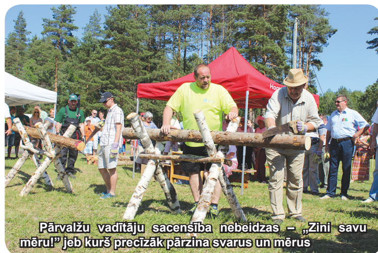
Pārvalžu vadītāju sacensība nebeidzas – „Zini savu mēru!” jeb kurš precīzāk pārzina svarus un mērus