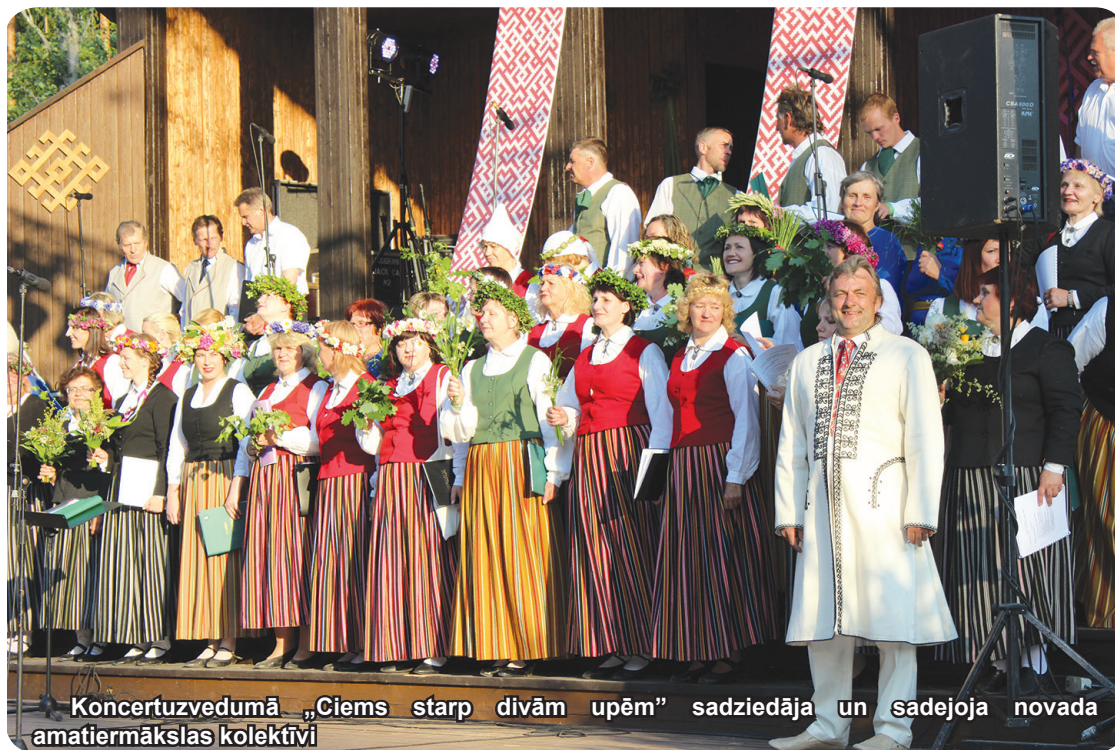
Koncertuzvedumā „Ciems starp divām upēm” sadziedāja un sadejoja novada amatiermākslas kolektīvi