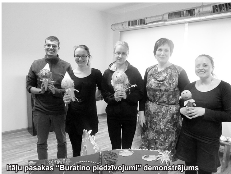
Itāļu pasakas “Burātino piedzīvojumi” demonstrējums