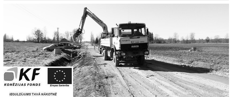
KF KOHĒZIJAS FONDS IEGULDĪJUMS TAVĀ NĀKOTNĒ

“Nosakot atbilstību trūcīgas ģimenes (personas) statusam, par kustamo īpašumu netiek uzskatīts viens transportlīdzeklis, tajā skaitā viena automašīna vai motocikls, kas ir vecāks par desmit gadiem un ģimenes īpašumā ir ilgāk nekā 24 mēnešus, kā arī velosipēds, mopēds, motorollers un auto piekabe katram ģimenes loceklim.”.