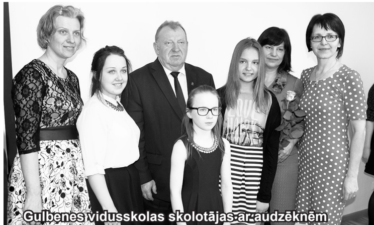
Gulbenes vidusskolas skolotājas ar audzēkņiem