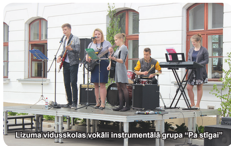
Lizuma vidusskolas vokāli instrumentālā grupa "Pa stīgai"