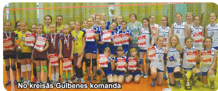
No kreisās Gulbenes komanda