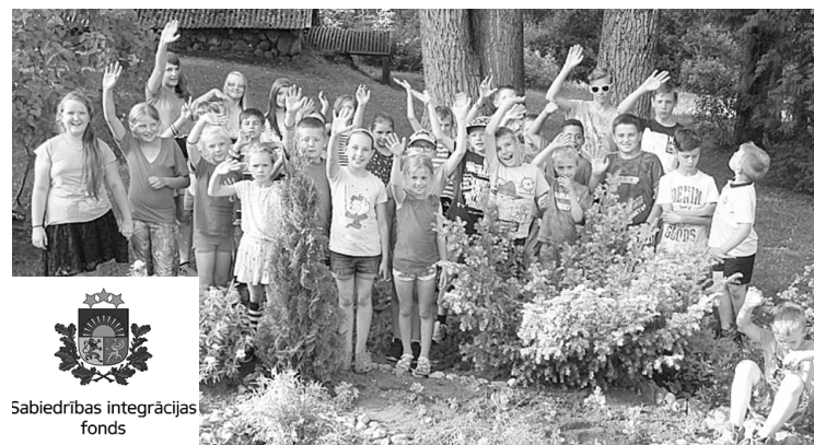
Sabiedrības integrācijas fonds

2015.gadā īstenotajā projektā „Vasaras nometne Latvijas un diasporas bērniem „Saule meta zelta loku”” ietvaros norisinājās 10 dienu gara vasaras nometne Latvijā un ārvalstīs dzīvojošajiem latviešu bērniem. Kopumā tika uzņemti 30 bērni, no kuriem 17 bija ārvalstīs dzīvojošie bērni no 7 dažādām valstīm – Spānijas, Īrijas, Igaunijas, Maltas, Anglijas, Beļģijas un Vācijas. Nometnes laikā dalībnieki izzināja saulgriežu svinēšanas