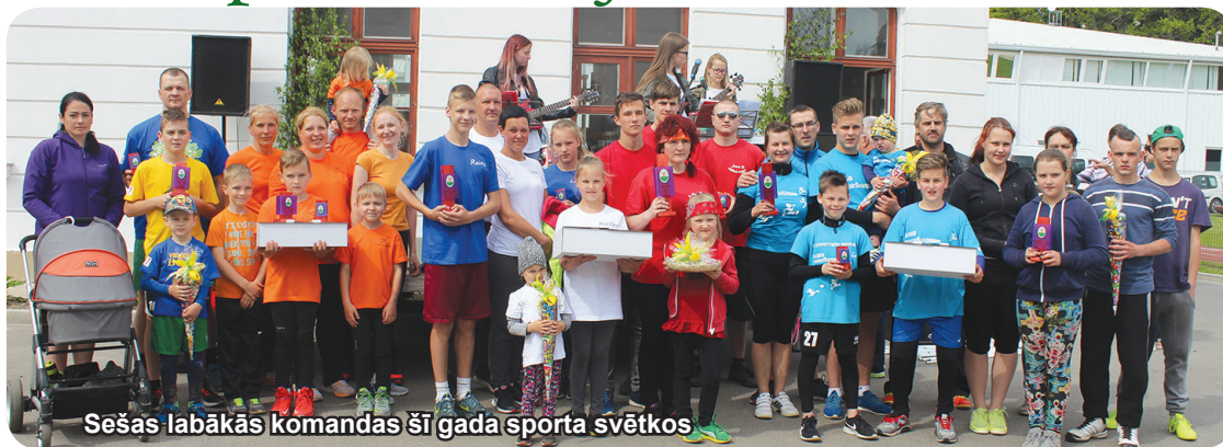
Sešas labākās komandas šī gada sporta svētkos