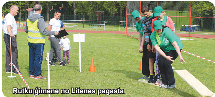
Rutku ģimene no Lītenes pagasta