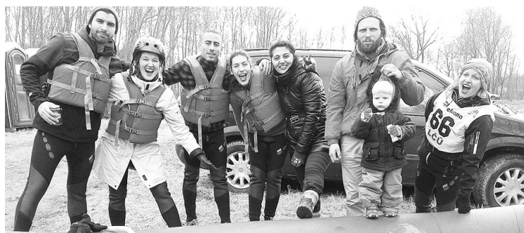
Abu projektu jaunieši piedalās Latvijas čempionātā ūdens-tūrismā. Gatavi ar raftu doties pa ledaino Dīvajās upi 25.martā.