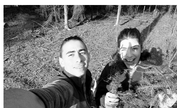
Mimmo ar Anu Luisu Meža stādīšanas talkā Jaungulbenē.