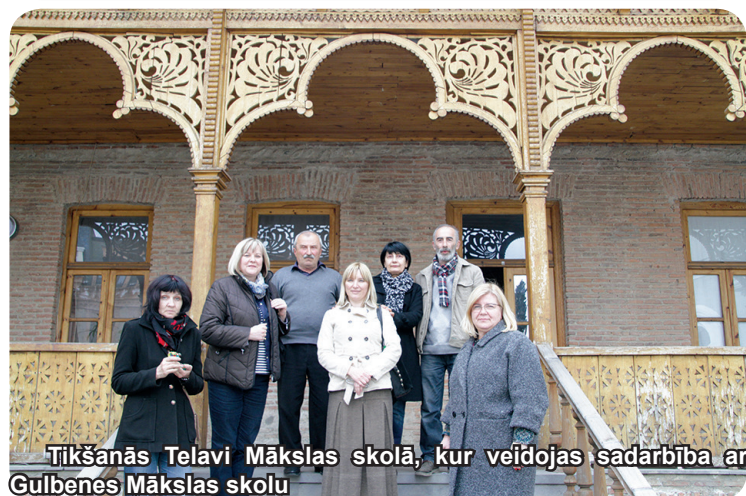
Tikšanās Telavi Mākslas skolā, kur veidojas sadarbība ar Gulbenes Mākslas skolu

Signagi Valsts muzeja apmeklējums, kurā iekārtota slavenā gruzīnu mākslinieka Niko Pirosmāni zāle