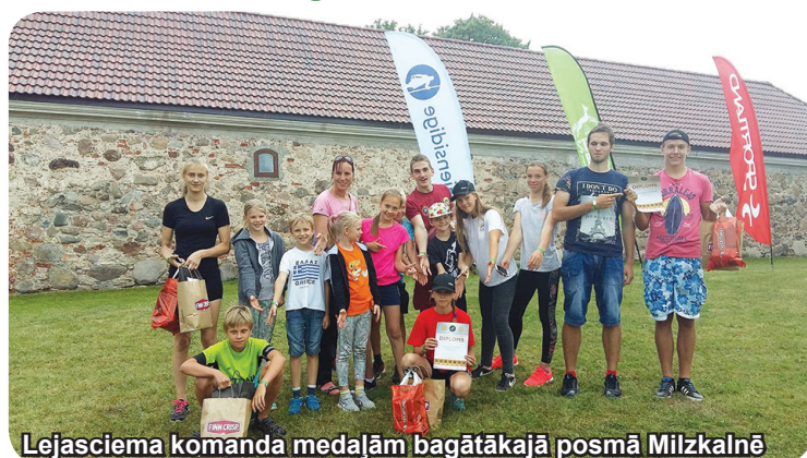
Lejasciema komanda medaļām bagātākajā posmā Milzkalnē

Individuāli LČ medaļas kopvērtējumā skolu jauniešiem tiks pasniegtas “Gada balvas vieglatlētikā 2017” ceremonijā, kas notiks 2018.gada janvārī. LČ