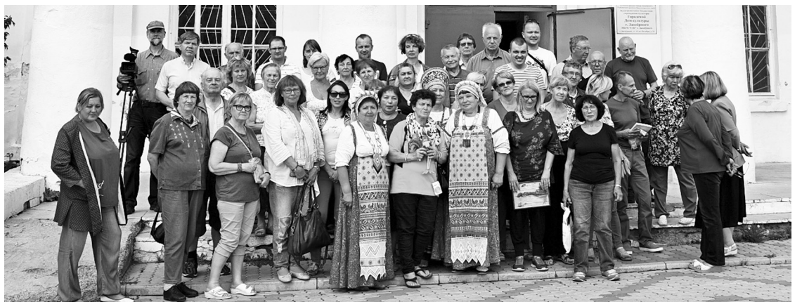
(2.turpinājums, sākums 27.septembra numurā)