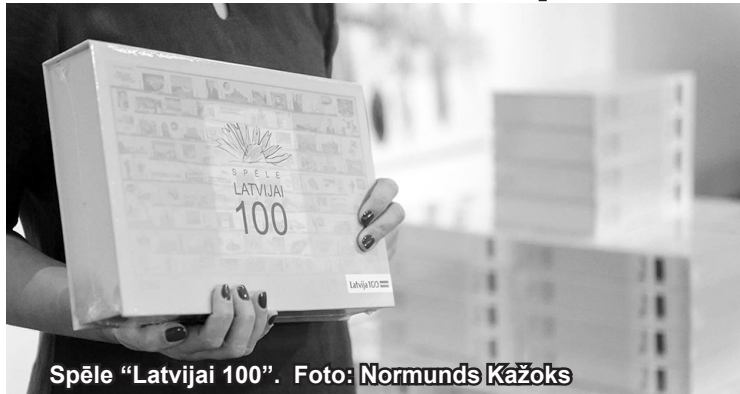
Spēle "Latvijai 100".

Tuvojoties Valsts svētkiem un Ziemassvētkiem, Gulbenes novada pašvaldības aģentūra "Gulbenes tūrisma un kultūrvēsturiskā mantojuma centrs" aicina ikvienu no 10.novembra līdz 22.decembrim iegriezties aģentūrā, Ābeļu ielā 2, Gulbenē, 101.kabinētā, lai iegādātos jaukas un mīļas dāvanīņas no īpašās akcijas "Radi sirdsprieku!" klāsta 11. un 18.novembrim, Ziemassvētkiem. Šeit varēsiet atrast Gulbenes novada mājrāžotāju un amatnieku ar mīlestību radītas lietas – koka rotas un aksesuārus, dažādas rokassprādzes, mājas gariņus, eglīšu rotājumus, medus izstrādājumus, vaska sveces un keramikas izstrādājumus. Aicinām dāvēt prieku saviem mīļajiem un tuvajiem cilvēkiem, iegādājoties šos nelielos suvenīrus – dāvanīņas! Pārdošanā piedāvā-